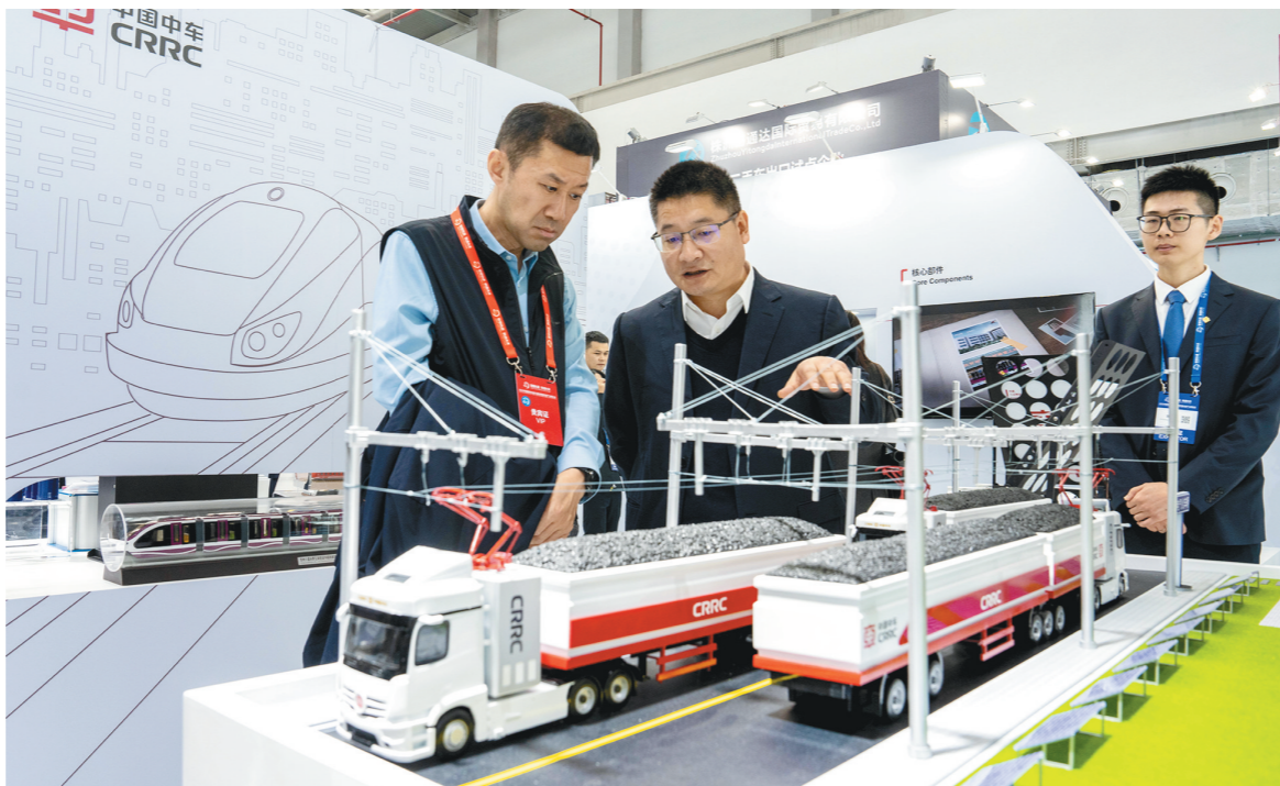
12月8日,2023中国国际轨道交通和装备制造产业博览会在湖南株洲开幕,本届博览会以“智慧轨道、联通未来”为主题,展览面积6万余平方米,600多家企业线上线下参展,集中展示和发布一批新产品、新技术、新成果,聚焦轨道交通行业产业、人才、创新、资金、政策等重点主题,共谋行业发展未来。