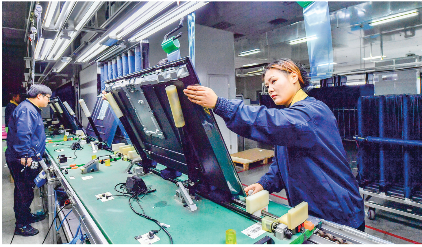
12月7日,工人在冠捷显示科技(咸阳)有限公司FAD生产车间组装生产线上作业。