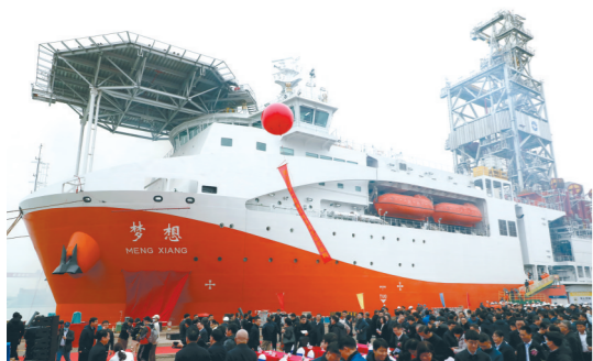
12月18日,我国自主设计建造的首艘大洋钻探船正式命名为“梦想”号,并在广州南沙首次试航。

这条总投资25亿元的生产线建成投产,标志着我省中厚板多年来主要依赖外购的时代结束,产品不仅可满足省内及四川汽车生产、航天制造等企业所需,还可覆盖重庆、甘肃等地区。中厚板是一种厚度4.5毫米至25毫米的钢板,一般应用于建筑工程、机械制造、压力容器、造船、桥梁建造等领域,主要通过热轧工艺生产。