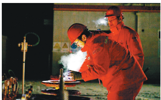
12月22日晚,在延安市安塞区,中国石油长庆油田分公司第一采气厂作业七区工作人员在巡检天然气输气设备,确保群众安全温暖过冬。

“在积极开展社会责任实践的同时,中央企业不断优化社会责任管理。”国务院国资委社会责任局副局长汪洋在活动上表示,目前,已有超九成的中央企业推进下属企业建立了社会责任组织体系,超四成中央企业已经制定了社会责任专项制度。