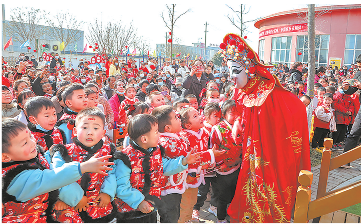
1月11日,由渭南市蒲城县文化和旅游局主办的“社火·庙会”非遗体验活动走进蒲城县第三幼儿园。活动中,舞龙舞狮、锣鼓秧歌、旱船等非遗节目轮番上演,加深了学生对非遗文化的了解,让他们在亲身体验中感受非遗文化的魅力。