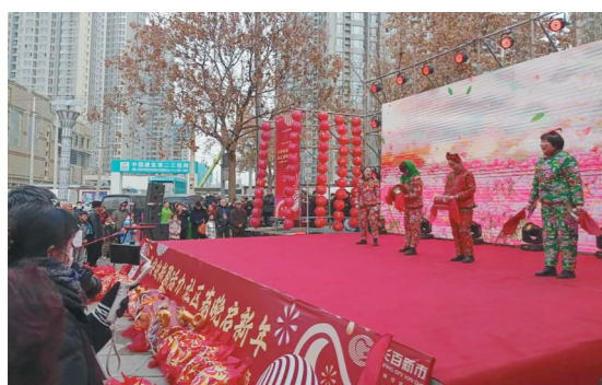
1月20日上午,由西安市长安区委宣传部、区文明办指导,长百新市生活广场主办的首届社区群众春晚开演。

据悉,年货节将持续至2月17日。线上组织电子商务企业在电商平台及线上旗舰店等开设年货节专区,推出“大型团购”“活动免费送”“优惠券”等活动。线下发动全市各县(市、区)商圈、步行街、汽车4S店、延安老字号等传统企业,以限时促销活动为主、特色游戏为辅,促进消费者与品牌互动,繁荣节日市场。