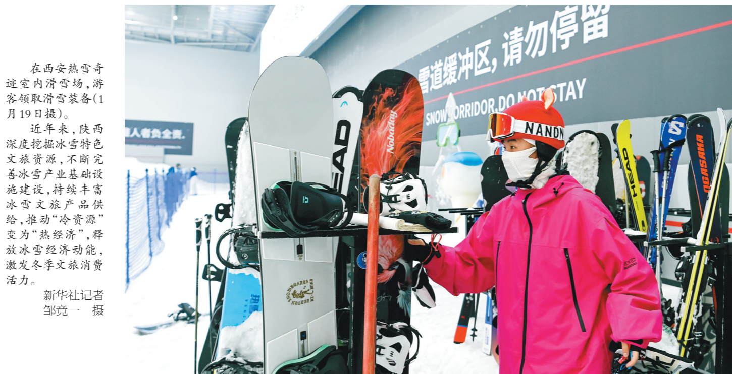
在西安热雪奇迹室内滑雪场,游客领取滑雪装备(1月19日摄)。近年来,陕西深度挖掘冰雪特色文旅资源,不断完善冰雪产业基础设施建设,持续丰富冰雪文旅产品供给,推动“冷资源”变为“热经济”,释放冰雪经济动能,激发冬季旅游消费活力。