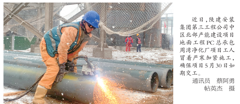
近日,陕建安装集团第三工程公司中北部分部建设项目地面工程PC总承包商周泽化项目工人冒着严寒加紧施工,确保项目5月30日如期完工。

管距离长、地质条件复杂等问题,积极协调各配合单位,聘请业内专家反复讨论,仔细研究施工图纸,最终决定采用适应性、稳定性高的土压平衡顶管施工工艺。施工团队倒排工期、攻坚克难、全力以赴,顺利完成顶管施工。