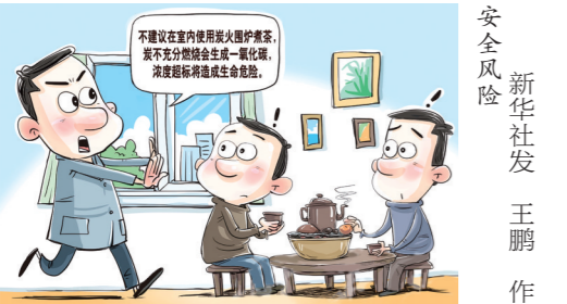
安全风险 新华社发 王鹏 作

当发现或怀疑一氧化碳中毒时,需立即开窗通风,尽快转移到通风良好区域,吸入新鲜空气。对于已经意识不清的人员,还要解开衣领,保持呼吸道通畅,特别要注意为其做好保暖,并尽快拨打急救电话或送往有条件救治的医院。