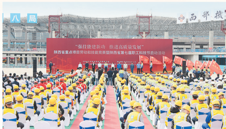
2023年5月23日,陕西省重点项目劳动和技能竞赛启动。