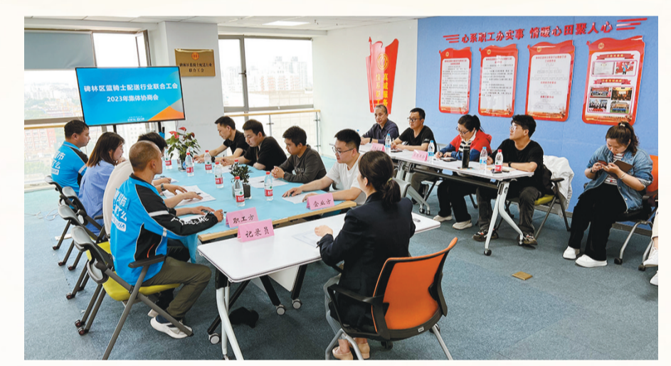
2023年5月30日,西安市碑林区蓝骑士配送行业集体协商会议举行。