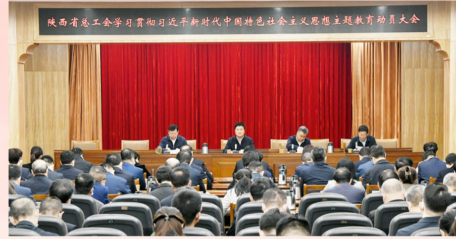
2023年4月13日,陕西省总工会学习贯彻习近平新时代中国特色社会主义思想主题教育动员大会召开。

截至2023年底,全省新建协商协调机制的企业达 287 家、覆盖职工 55633 人