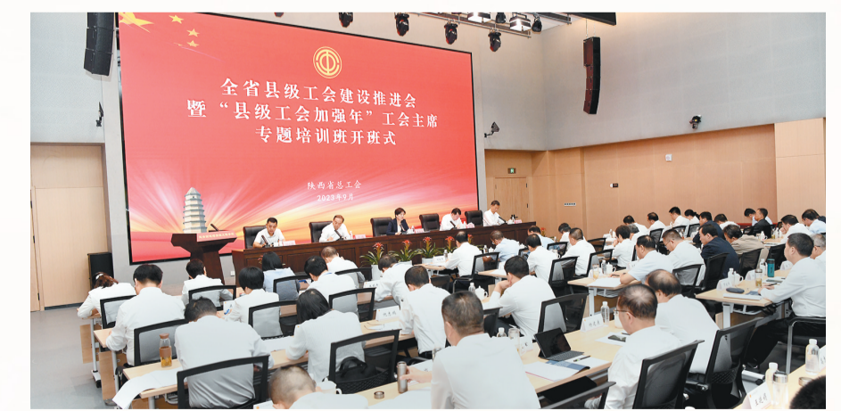
2023年9月15日,全省县级工会建设推进会暨“县级工会加强年”工会主席专题培训班开班式举行。