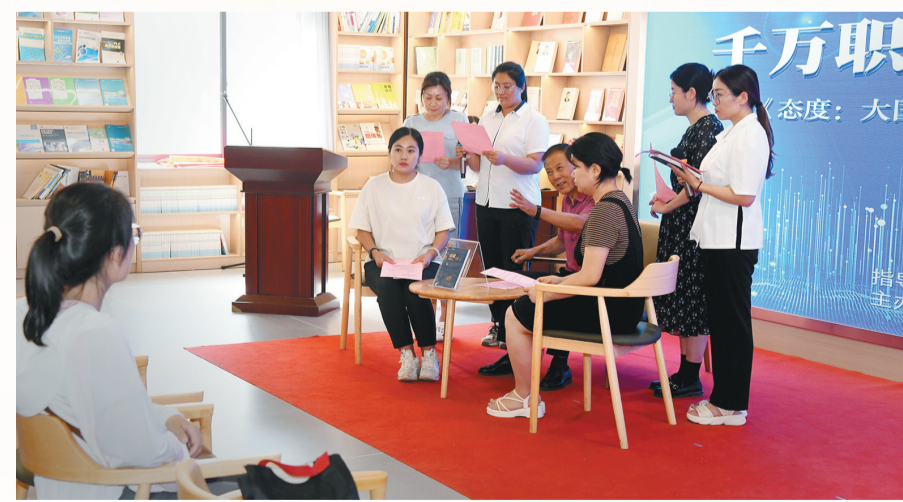
2023年7月10日,职工参加在西安市总工会示范职工书屋举办的全民阅读活动。