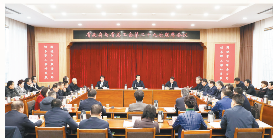
2023年12月19日,省政府与省总工会第二十九次联席会议举行。