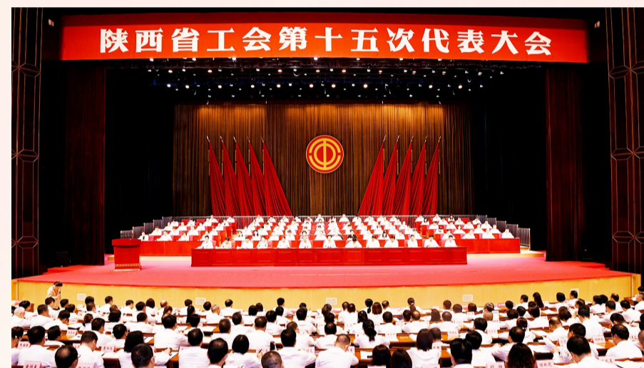
2023年8月29日,陕西省工会第十五次代表大会隆重召开。