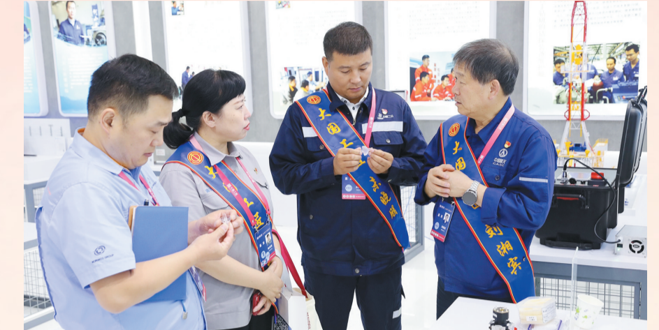
2023年7月28日,在全国第二届大国工匠创新交流大会上,省内外大国工匠创新成果相互交流。

强”示范县级工会20个。大力推进基层工会建设,全省已建成市区域性、行业性工会联合会31个,县级区域性、行业性工会联合会233个,吸纳新就业形态劳动者工会会员29.66万人,较上年年底增加51%。工会组织覆盖面上取得突破性增长,“县级工会加强年”专项工作在全国总工会两次有关工作会议上作交流发言。