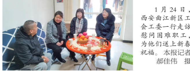
1月24日,西安曲江新区工会工委一行走访慰问困难职工,为他们送上新春祝福。