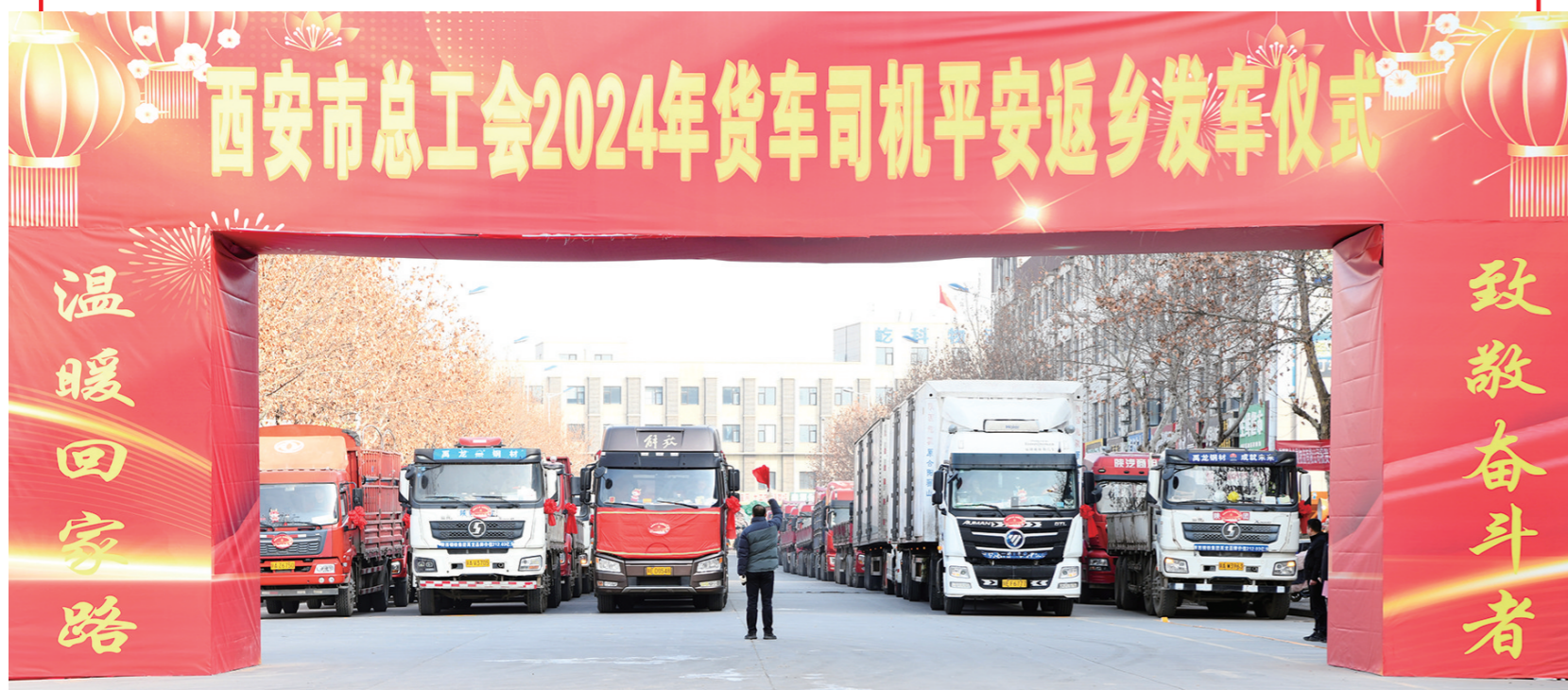
↑1月25日,西安市总工会2024年货车司机平安返乡发车仪式在陆港建材物流园举行。爱心礼包、加油卡……上百名货车司机带着“娘家人”的关爱和祝福返乡过年。