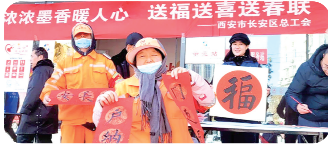
1月22日,西安市长安区总工会启动“迎新春 送春联”系列活动,为环卫工人、快递小哥等户外劳动者送去新春祝福。