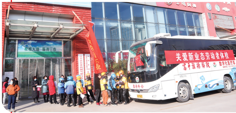
↓1月23日,渭南市富平县总工会开展“暖冬行动”暨新业态劳动者集中入会仪式。图为仪式开始前进行的免费体检活动。