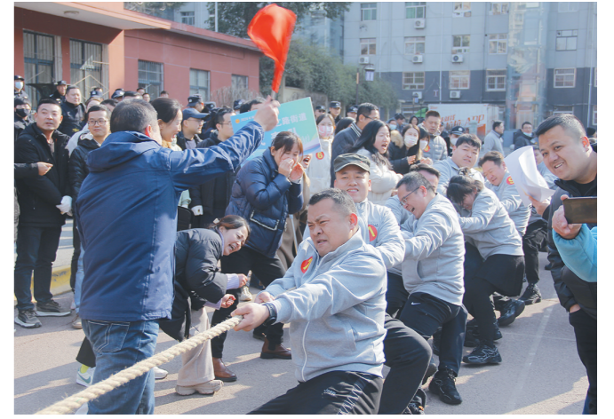
1月26日,西安市碑林区总工会举办“中国梦·劳动美——凝心铸魂跟党走 团结奋斗新征程”2024年碑林区职工拔河比赛。来自全区各级机关、街道及企事业单位的30支代表队,500余名运动员齐聚赛场,展现了干部职工健康向上、勇于拼搏的精神风貌。