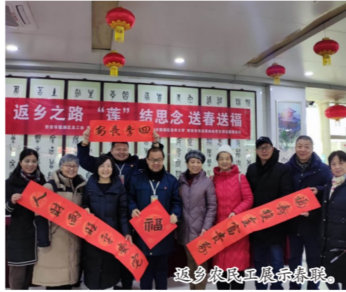
返乡农民工展示春联。

莲湖区总工会还组织20余名工作人员和志愿者为返乡农民工现场提供法律法规咨询、购票帮助、乘车引导、行李托运、安全检查等服务。现场发放《工会法》《劳动合同法》《家庭健康管理必备知识》《新就业形态劳动者劳动权益保障服务手册》等宣传书籍和彩页。