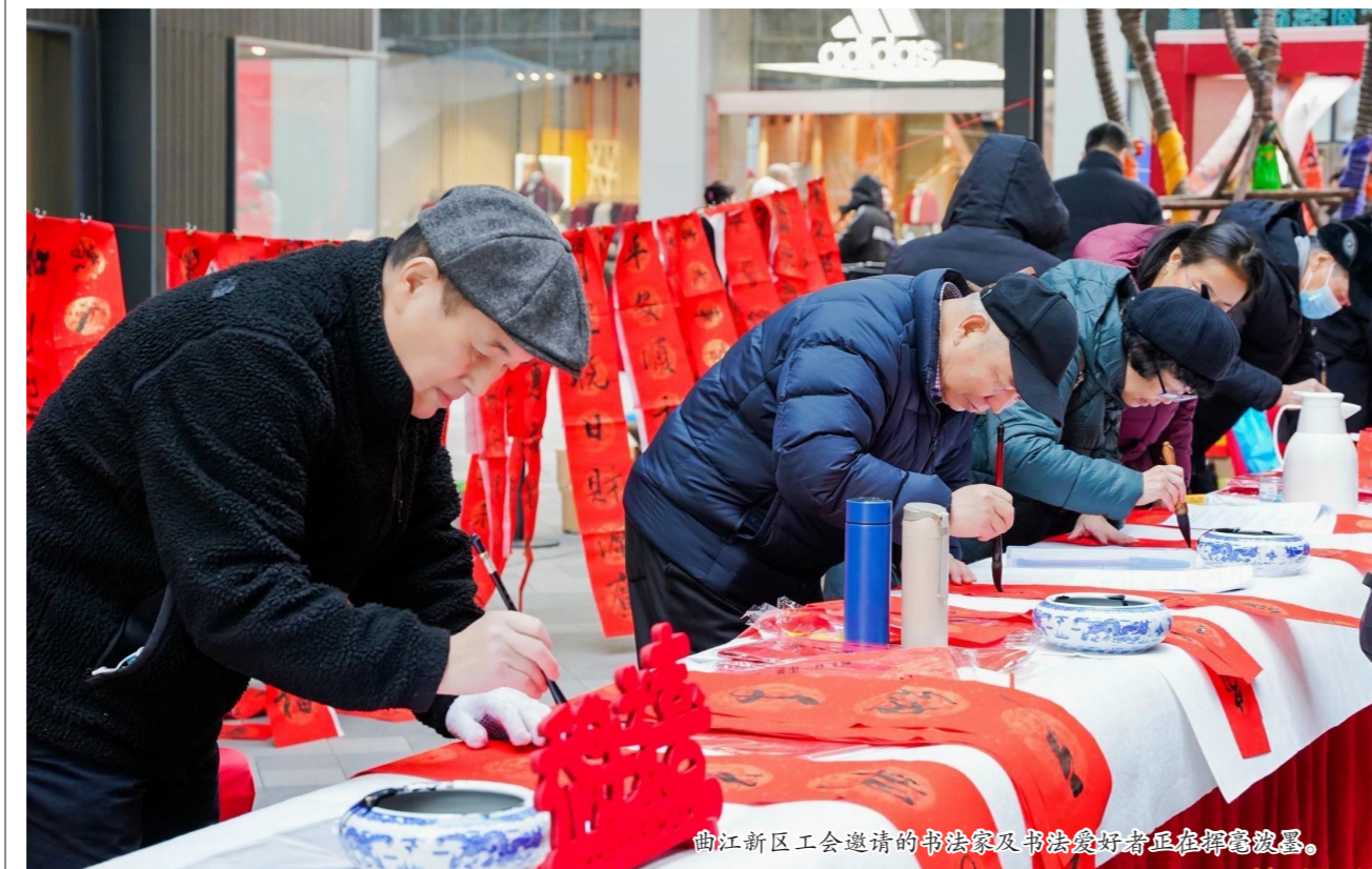
曲江新区工会邀请的书法家及书法爱好者正在挥毫泼墨。