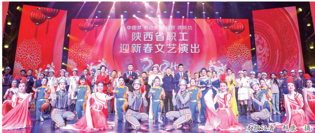
三秦职工共欢歌 同心筑梦启新程 ——陕西省职工迎新春文艺演出侧记 详见第四版