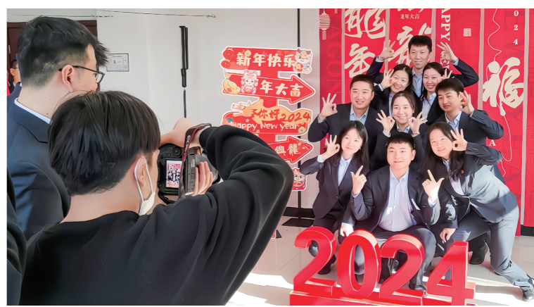
春节来临之际,陕煤运输榆林公司工会开展“情暖职工,定格幸福”新年贺岁摄影活动,为职工送去新年的第一份美好祝福。

据介绍,从1月初到现在,省教科文卫体工会先后走访了西安交通大学、陕西科控集团、陕西广电融媒体集团、省乒乓球羽毛球网球运动管理中心、西安国际医学中心、陕西铁路工程职业技术学院、西安小学等30余家基层单位和延安市教育工会、商洛市教育工会等3个地州市产业工会,实地看望慰问了1000余名职工。近三年在元旦春节期间,省教科文卫体工会已累计下拨补助资金520余万元用于开展送温暖活动。