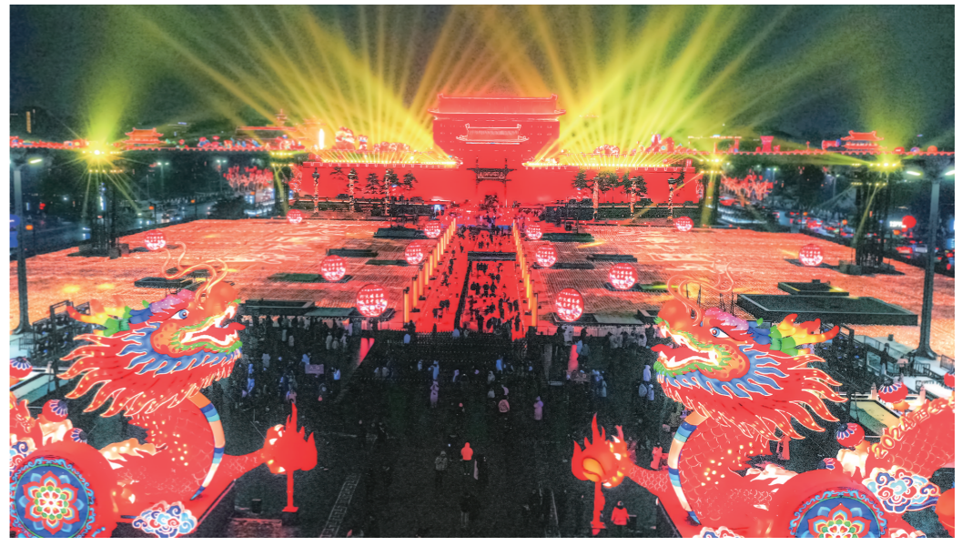
2月8日晚,西安南门外流光溢彩迎新春。