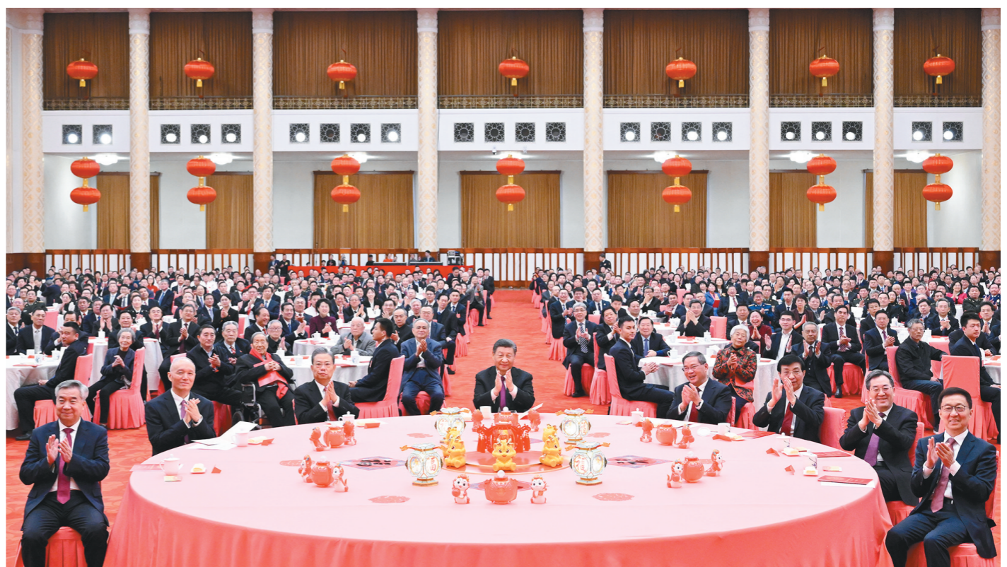
2月8日,中共中央、国务院在北京人民大会堂举行2024年春节团拜会。党和国家领导人习近平、李强、赵乐际、王沪宁、蔡奇、丁薛祥、李希、韩正等同首都各界人士齐聚一堂,共迎新春。

新华社北京2月8日电 中共中央、国务院8日上午在人民大会堂举行2024年春节团拜会。中共中央总书记、国家主席、中央军委主席习近平发表讲话,代表党中央和国务院,向全国各族人民,向香港特别行政区同胞、澳门特别行政区同胞、台湾同胞和海外侨胞拜年。