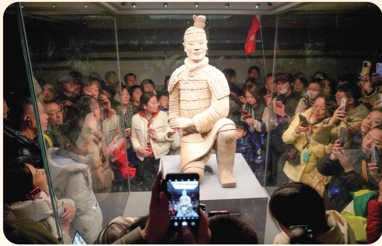
2月16日,游客在秦兵马俑二号坑遗址观看跪射俑。