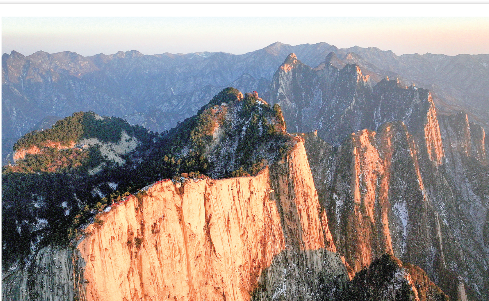
春登华山览奇峰险秀