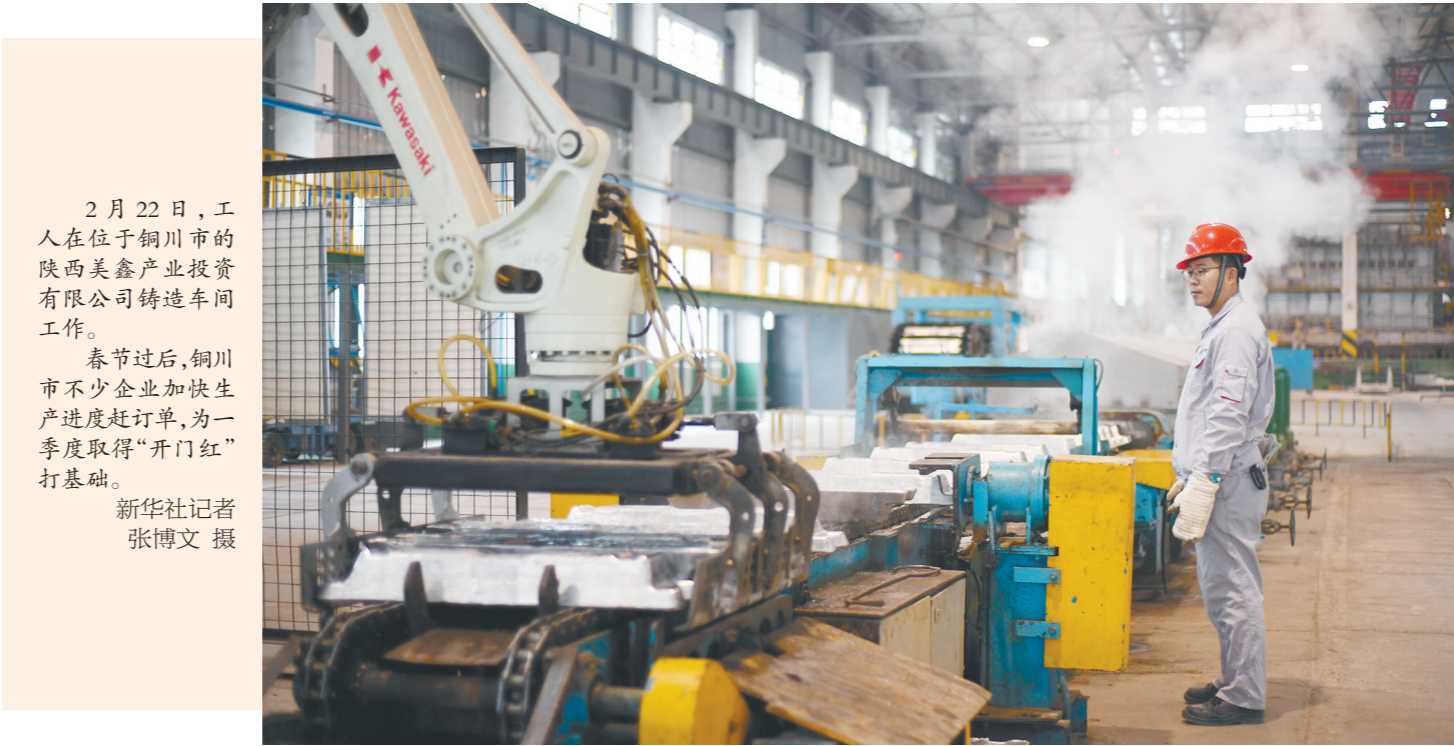
2月22日,工人在位于铜川市的陕西美鑫产业投资有限公司铸造车间工作。 春节过后,铜川市不少企业加快生产进度赶订单,为一季度取得“开门红”打基础。