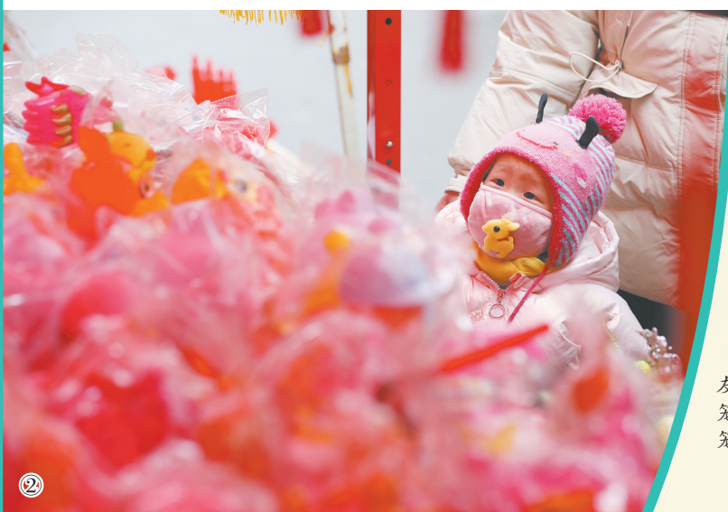
②2月23日,小朋友在商洛市洛南县灯笼市场挑选喜欢的灯笼玩具。