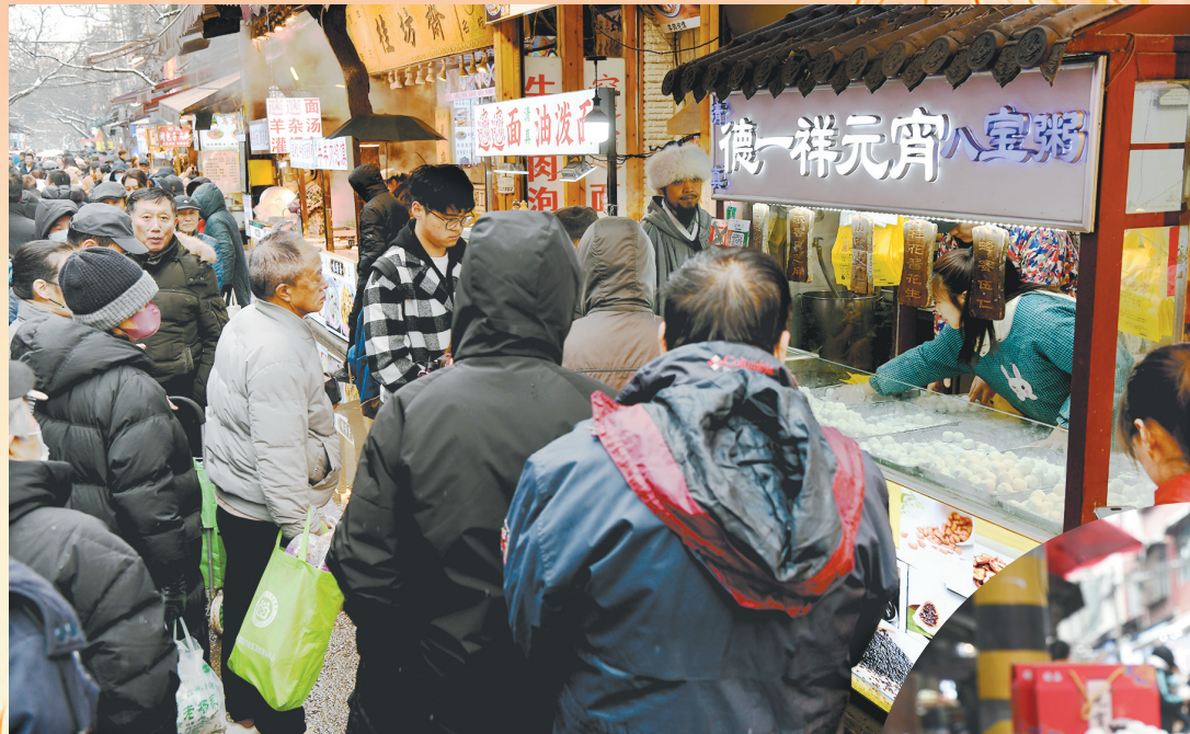
市民在西安市回民街购买元宵。