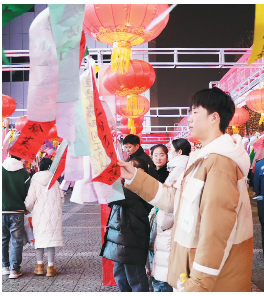
2月23日,市民在咸阳市工人文化宫举办的元宵灯谜有奖竞猜活动现场猜灯谜。