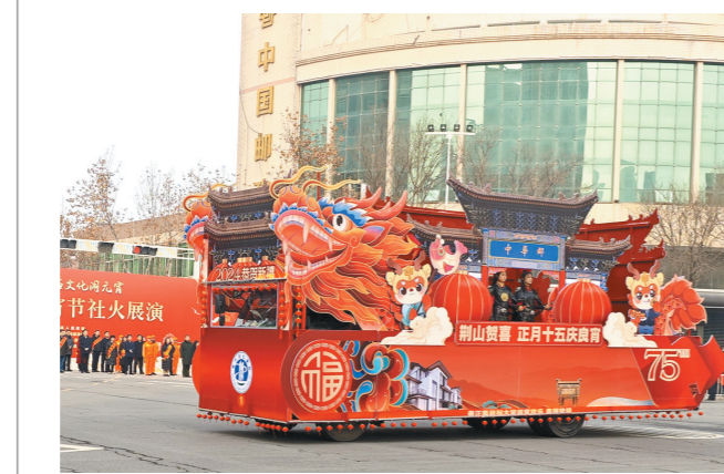
2月24日,富平县各界职工群众走上街头进行社火表演。

谈及今年即将召开的全国两会,姬桂玲将继续立足农村,围绕农业产业发展、让农民过上好日子提出自己的相关建议。 本报记者 王何军