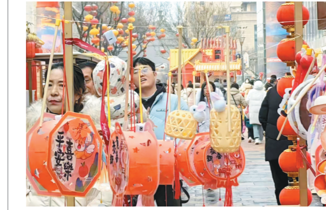
2月24日,游人在西安皇城根里民俗园步行街游玩。