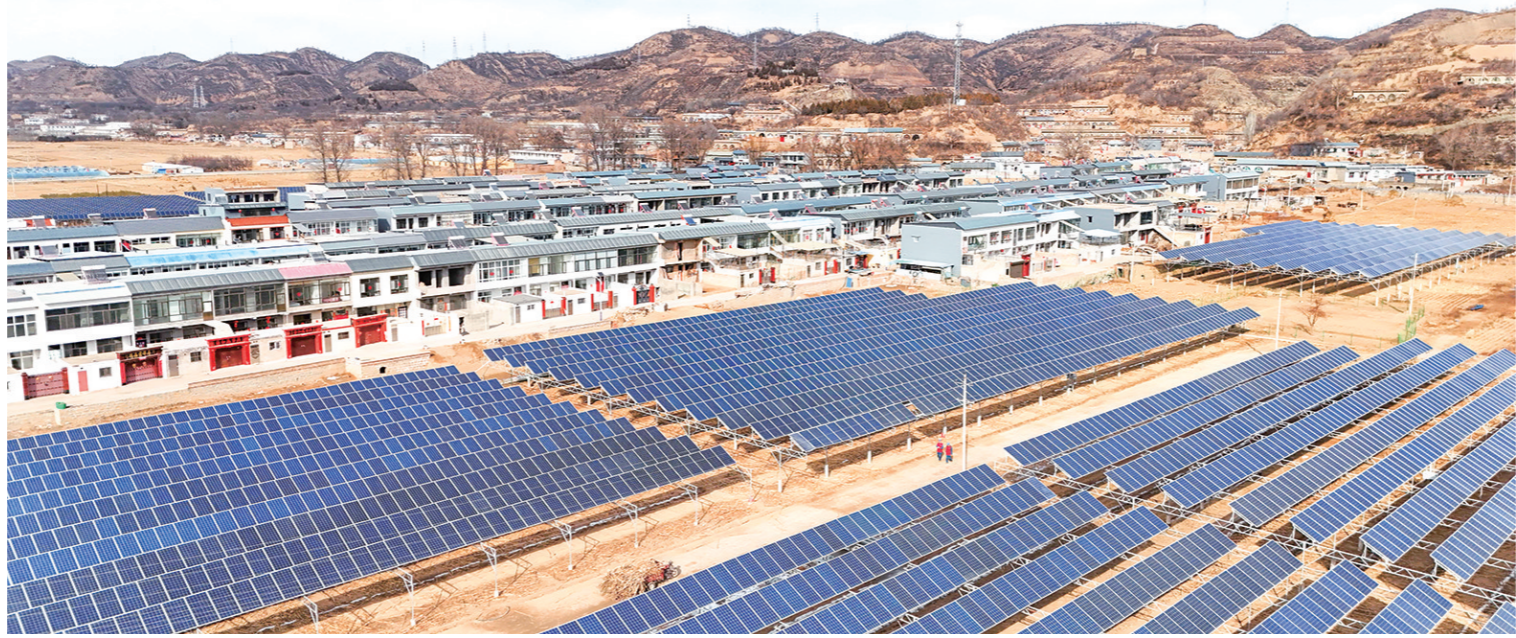
位于米脂县井家畔村的光伏电站(无人机照片,3月1日摄)。 地处黄土高原腹地的榆林市米脂县积极利用光照充足的天然优势,有序建设集中式和分散式光伏

运用“全域+”思维理念,着力在“理论武装内化、产改工作深化、维权服务优化、基层基础强化、方法手段现代化、作风能力硬化”上下功夫,团结引领广大职工在创新推进中国式现代化西安实践中充分发挥主力军作用。