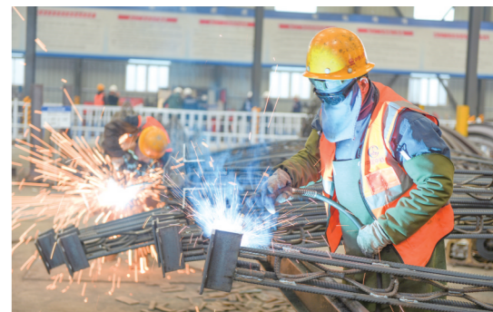
2月29日,中铁七局建设者在西安至十堰高铁项目三标段钢构件加工厂施工。春节过后,参建单位全力推进项目跑出“加速度”。

意见明确五项任务。一是服务网点覆盖基层,聚焦产业集聚区等区域,布局基层就业服务网点,形成覆盖城乡、便捷可及的就业服务圈。二是服务信息辐射基层,推广“大数据+铁脚板”服务模式,支持街道(乡镇)、社区(村)精准实施就业服务和重点帮扶。三是服务力量下沉基层,县级公共就业服务机构工作人员下沉基层服务网点开展就业服务,定期组织职业指导师等深入基层服务网点提供服务。四是服务模式适应基层,探索预约服务、上门服务等便民措施。五是服务供给支撑基层,形成服务主体多元化、服务方式多样化的基层就业服务供给模式。