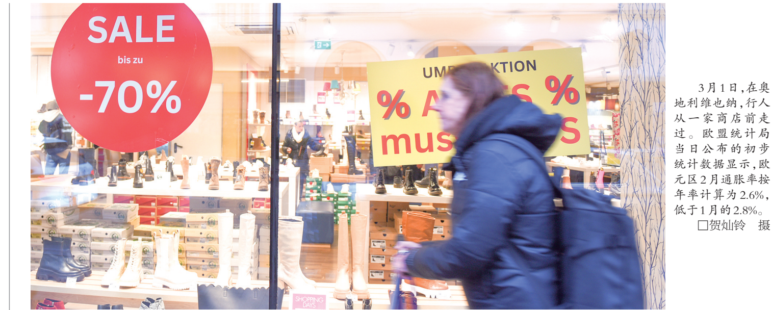
3月1日,在奥地利维也纳,行人从一家商店前走过。欧盟统计局当日公布的初步统计数据显示,欧元区2月通胀率按年率计算为2.6%,低于1月的2.8%。