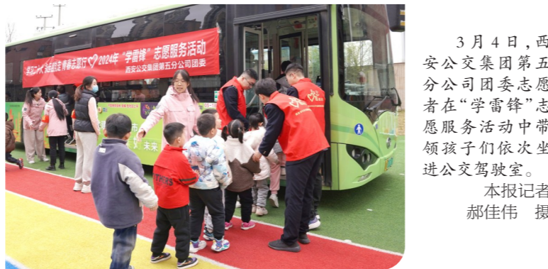
3月4日,西安公交集团第五分公司团委志愿者在“学雷锋”志愿服务活动中学雷锋,志愿者们依次乘坐进公交车驾驶室。