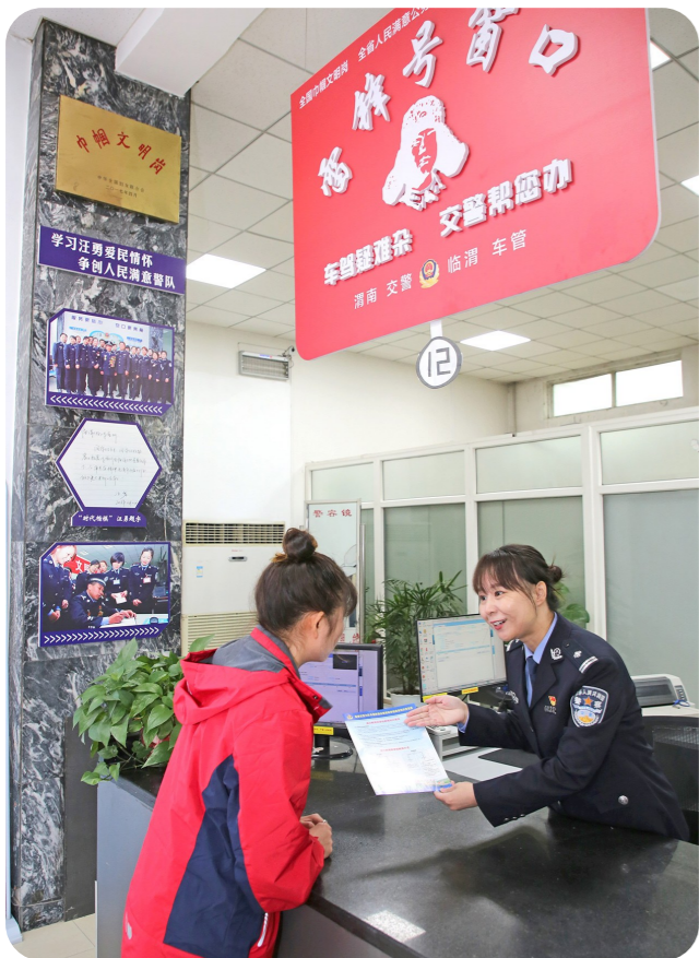
3月5日,“全国文明典范”渭南市公安局交警支队临渭大队车管所,民警为前来办理业务的群众答疑解惑,宣传“放管服”政策,让群众办事更方便。