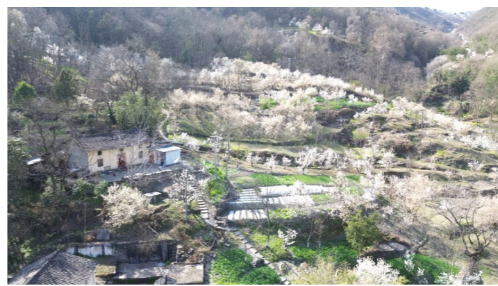
樱花被誉为“脱贫之花”,如今已成为当地群众致富的一项龙头主导产业。

目前,新中式消费群体在人群结构上呈现出年轻、多元的趋势,催生出越来越细分的场景需求。除了服装领域,“新中式”的热潮还席卷了美食、养生、家居等多个领域,也带动了国风写真、古城游览等诸多文旅活动。“可以尝试与更多传统文化联结起来,完成服饰与应用场景的多元化探索,使新中式成为更多消费者审美的长期主流,让传统文化在与现代生活碰撞中获得新的生命力。”楠玉说。