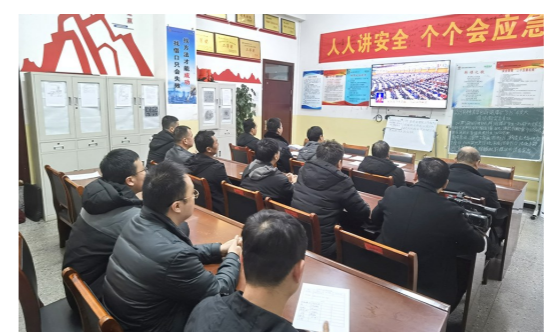
近日,韩城矿业桑坪二号井在抓好安全生产的同时,组织干部职工收听收看全国两会盛况。

据介绍,此次动力系统试车要经历正常任务剖面点火、加注/泄出、停放24小时点火过程,模拟发射场推迟发射两种故障模式,验证处置方案的正确性,实现对长征八号改进型火箭二子级箭上、地面各系统的全面考核,为后续型号首飞提供保障。