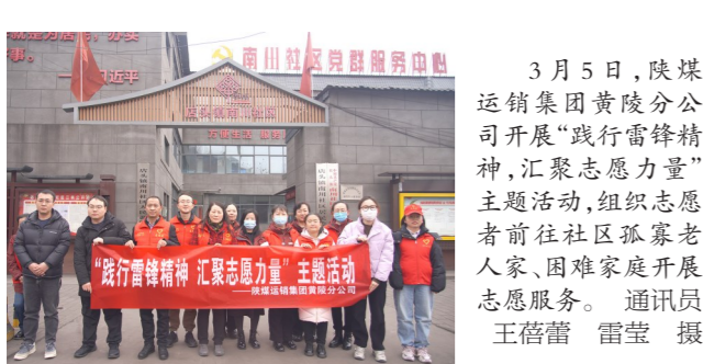
近日,陕西十五建公司团支部开展学雷锋纪录片、学雷锋演讲比赛及雷锋知识竞赛等系列活动。

空军军医大学开展学雷锋志愿服务活动 本报讯(记者 宁黛艳)3月4日至5日,空军军医大学在西安市大雁塔南广场开展学雷锋“张华传人”志愿服务活动。来自该校西京医院、唐都医院、口腔医院、986医院的数百位专家教授,将呼吸内科、心内科、骨科等重点科室搬到群众“家门口”,近距离、面对面进行现场问诊。 据了解,42年前,该校校友张华为挽救老农生命英勇牺牲。张华曾在日记里多次提到要向雷锋同志学习,他也用实际行动践行雷锋精神。自2021年起,该校决定在每年的学雷锋纪念日开展学雷锋“张华传人”志愿服务活动。 今年,空军军医大学采取义诊、巡回和志愿服务相结合的形式进行志愿服务。在百名专家教授义诊现场,专家们耐心地与每一位前来咨询、就诊的群众进行交流,详细询问就诊群众的身体状况、既往病史,为他们进行诊疗、答疑。现场还为需要进一步检查的患者提供“绿色就医通道”,确保患者后续治疗无后顾之忧。 据介绍,今年是空军军医大学开展学雷锋“张华传人”志愿服务活动的第四年,已累计问诊上万名市民。