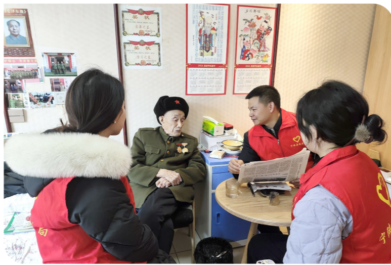
3月5日,宁陵县住建局开展学雷锋系列活动,走访慰问参加过抗美援朝战争的退役老兵,听老兵讲雷锋故事。