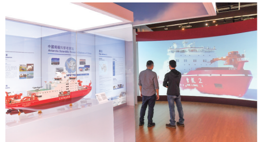
3月19日,观众在“极地科研与气候变化”展上参观。3月18日至6月26日,“极地科研与气候变化”展在香港科学馆举办,展出中国极地科考破冰船“雪龙2”号的极地探索任务及成果。

市场监管总局统计显示,截至2024年2月底,共归集1.85亿户经营主体各类涉企信用信息117.71亿条。市场监管总局以多种方式向各部门共享企业信用信息,直接提供数据共计106.61亿条,提供接口调用服务17.92亿次。