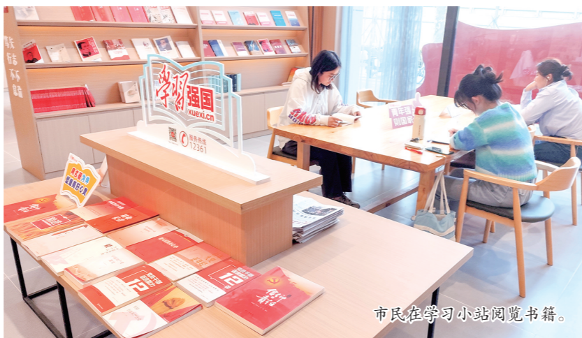
市民在学习小站阅读书籍。

本报讯(记者 刘强)近日,由“学习强国”西安学习平台承办的“学习强国”西安学习平台上线四周年主题活动暨西安市总工会示范职工书屋“学习强国”学习小站启用仪式在市总工会示范职工书屋举办。