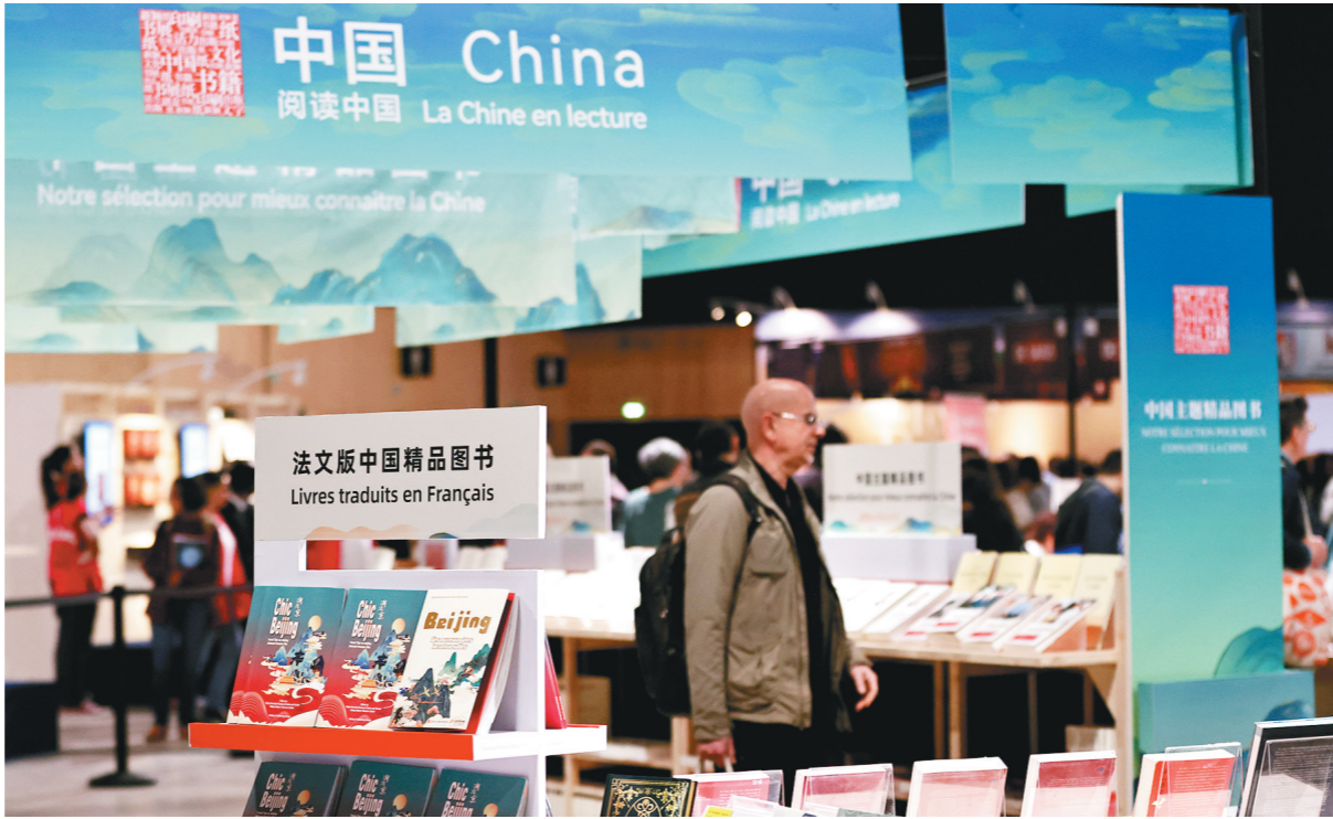
这是4月12日在法国巴黎临时大皇宫举行的2024巴黎书展上拍摄的中国图书展一角。为期三天的2024巴黎书展当日开幕。约1150种中国图书在本届书展上亮相,其中法文版超过40%。