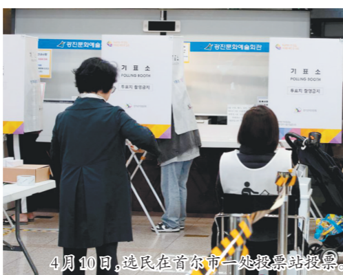
4月10日,选民在首尔市一处投票站投票。