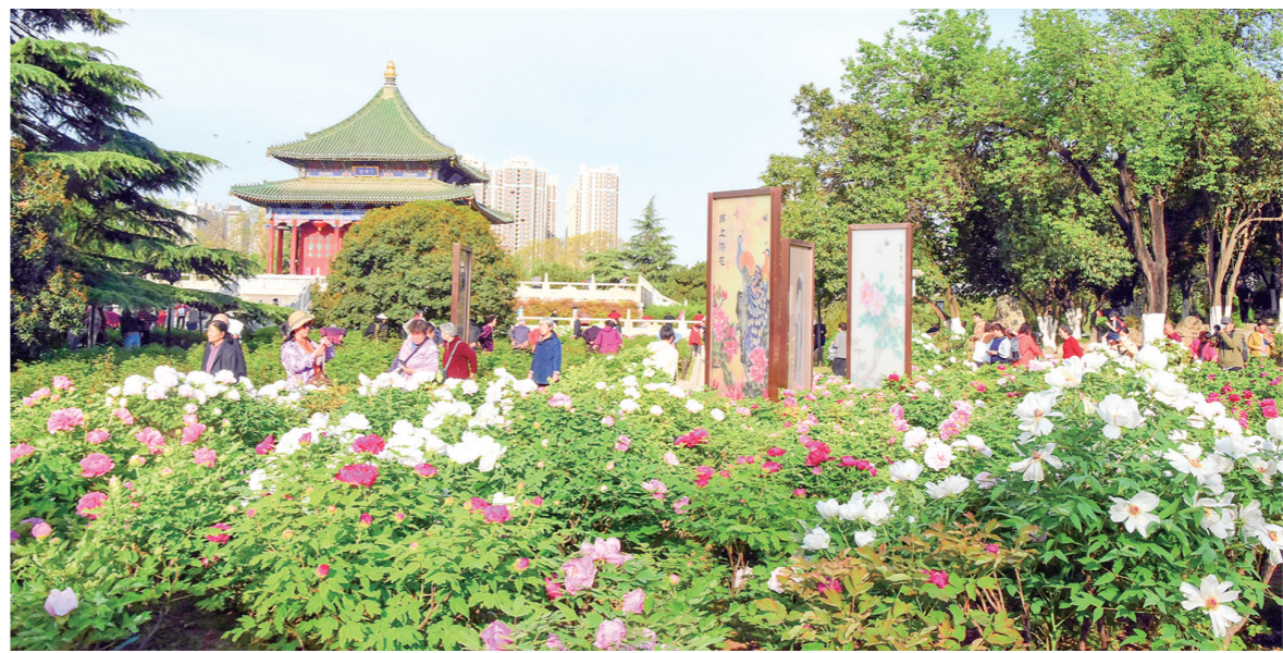
唯有牡丹真国色,花开时节动京城。近日,西安市兴庆宫公园沉香亭下万余株牡丹竞相绽放,雍容华贵、高雅端庄的风姿吸引了众多市民游客前来赏花,感受春日的勃勃生机。

此外,从投诉举报领域分析,首饰、洗涤染色服务、美容美发洗浴服务投诉量较上季度增长明显。其中,洗涤染色服务投诉量首次进入季度服务类投诉前10位,反映出受季节、消费者需求等影响,相关领域消费增长,投诉举报量随之增长。