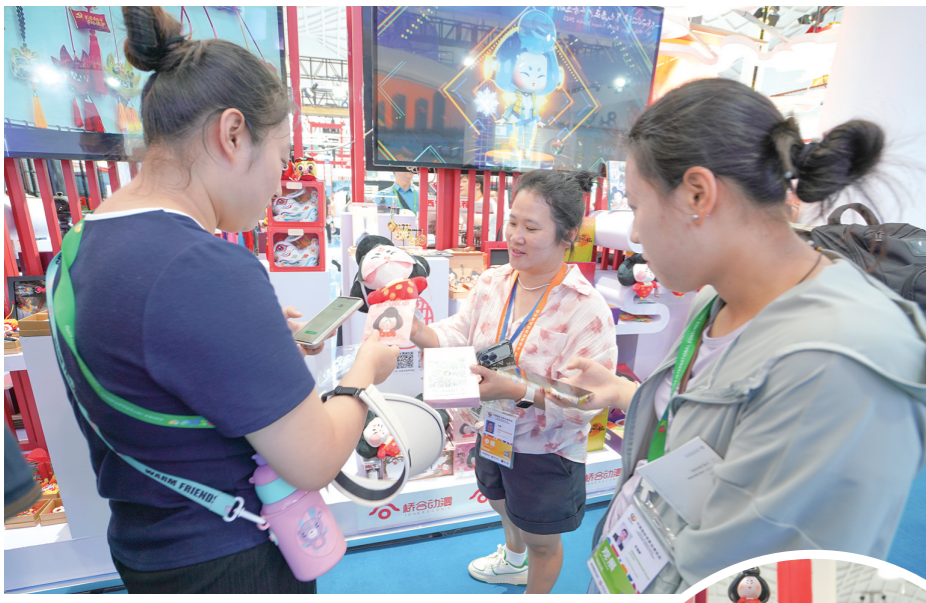
参展商(中)向参观者推介「唐妞」文创产品。