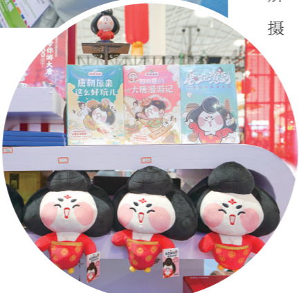
陕西展台上的「唐妞」文创产品。

浓缩精品,科技感拉满;传承工艺,老字号吸睛;注入活力,国货潮品成时尚主流。4月14日,在第四届中国国际消费品博览会(以下简称消博会)上陕西消费优品展强势出圈,高端工业品、新消费品、文创旅游、知味陕西……这些特色展品无一不在诠释陕西消费品企业“高新优特”的品牌新形象,并透过消博会这一窗口,洞察消费新趋势,感知市场新动态,拥抱发展新机遇。