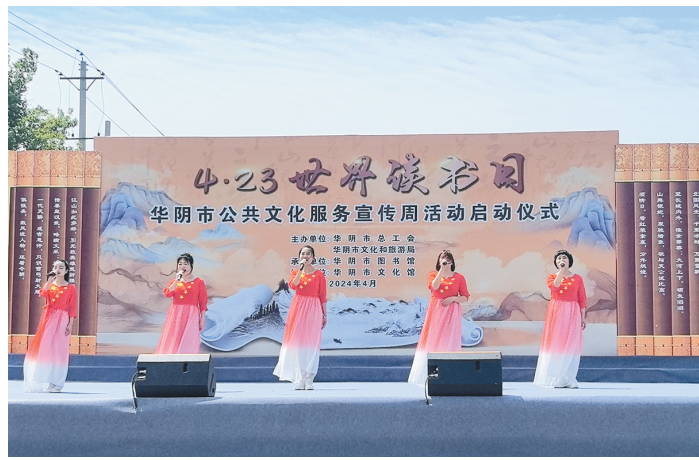
4月23日,中国兵器工业试验研究院参加地方政府组织的读书活动。图为职工朗诵《月光下的中国》。