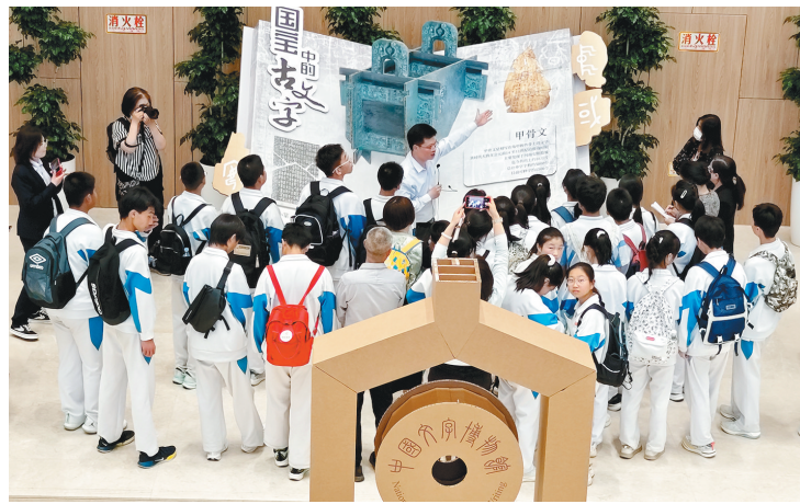
4月23日,陕西省“4·23世界读书日”暨公共图书馆服务宣传周系列活动启动仪式在省图书馆高新馆区举行。图为首次亮相的“国宝中的古文字”立体装置、“人在字中”体验项目现场。