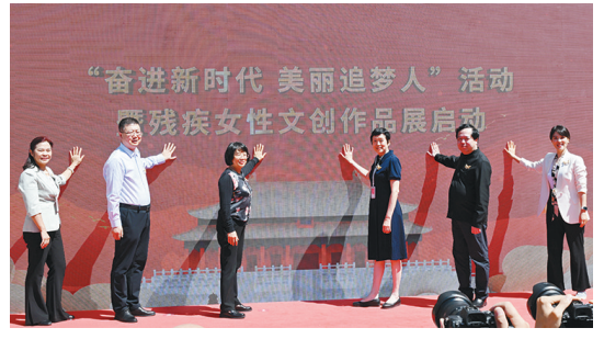
5月12日，“奋进新时代 美丽追梦人”活动暨残疾人文艺作品展在北京故宫博物院启动。集中展示了全国28个“美丽工坊”残疾女性创作的100余件（套）刺绣、编织等作品。

西安至十堰高速铁路是陕西“米”字形高铁网中重要的一“捺”，该条高铁途经西安、商洛、十堰三市，接入已建成的武汉至十堰高铁，新建正线长255.7公里，设计速度为每小时350公里，其中陕西段总长169公里，沿途设西安东、蓝田、商洛西、山阳、漫川关5站。