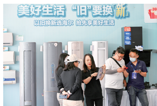
5月17日,全国消费品以旧换新行动——山东站暨2024全国家电消费季启动仪式在青岛举行。

据悉,工信部将加快推动信息通信业核心技术突破,全力提升产业链供应链韧性和安全水平,面向新型工业化,深化“5G+工业互联网”融合应用,助力企业“质改数转网联”,面向社会生活,在教育、医疗、养老等领域深化数字技术集成创新和融合应用。