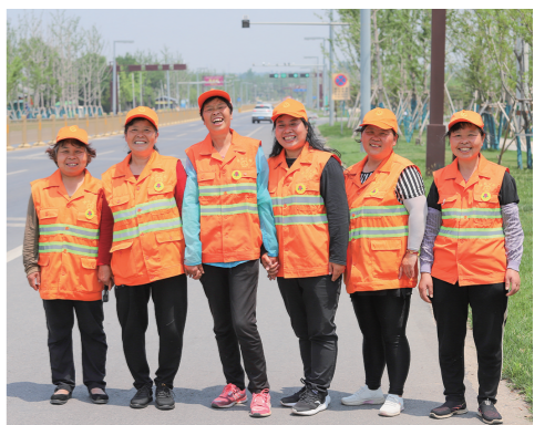
秦陵道班6名女工合影。