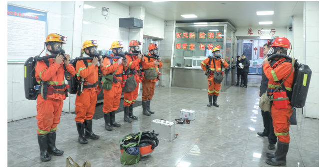
近日,陕建韩城矿业象山矿开展2024年度水害事故应急救援演练。

本报讯(通讯员 武艳飞 张雯)近日,陕建十一建集团承建的新津和园DK-1安置房项目提前80天完工,并通过竣工验收。 该项目作为安置保障房工程,位于西安市沣西新城地铁5号线与丰耘路交汇处,总建筑面积约28万平方米,单体最高32层,2112套住房将安置三个自然村约15000人。项目BIM策划方案荣获陕西省第六届“秦汉杯”BIM应用大赛优秀成果,并被评为省级绿色施工示范工程、省级优质结构工程。