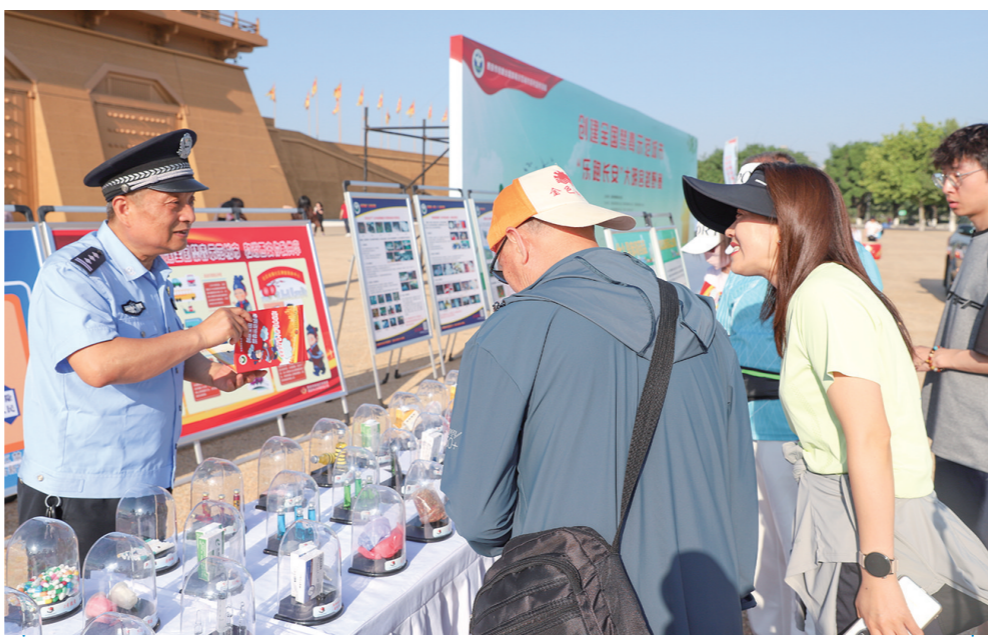
5月24日,2000名市民齐聚西安大明宫国家遗址公园,参加“创建全国禁毒示范城市‘乐跑长安’大明宫越野赛”禁毒宣传活动。图为民警介绍禁毒知识。

总额400亿元! 5月24日,首期20年超长期特别国债在北京证券交易所顺利发行。从今年开始拟连续几年发行超长期特别国债,专项用于国家重大战略实施和重点领域安全能力建设。今年政府工作报告提出之后,超长期特别国债备受关注。‘国债’‘超长期’‘特别’,这一组合代表什么意义? 国债,是国家为了筹集财政资金而发行的一种政府债券。一般认为发行期限在10年以上的利率债为‘超长期债券’。和普通国债相比,超长期债券有助于缓解中短期偿债压力。 特别国债的‘特别’之处,就是具有特定用途、服务专项需求,资金使用针对性强、效果显著。我国曾在1998年、2007年和2020年分别发行过3次特别国债。从历史经验来看,特别国债发行将对经济社会稳定向好发展产生积极影响。 从支持领域来看,超长期特别国债重点聚焦加快实现高水平科技自立自强、推进城乡融合发展、促进区域协调发展、提升粮食和能源资源安全保障能力、推动人口高质量发展、全面推进美丽中国建设等方面的重点任务。 从今年的发债‘日程表’看,自5月中旬持续至11月中旬,20年、30年和50年超长期特别国债将分别发行7期、12期、3期,首发日期分别为5月24日、5月17日、6月14日。5月17日发行的30年超长期特别国债,市场认购热情高涨。 24日首发的20年超长期特别国债有何特点? 据了解,此次发行的20年超长期特别国债为固定利率附息债,票面利率通过竞争性招标确定,自2024年5月25日开始计息,每半年支付一次利息。 此次招标利率水平可以看作市场欢迎程度的‘风向标’。招标结果显示发行利率为2.49%,市场认购积极。 南开大学金融发展研究院院长田利辉介绍,超长期特别国债的利率会根据市场供需关系和投资者的认购热情来确定,市场需求旺盛表明投资者对该国债的接受度较高。 ‘20年超长期特别国债有助于构筑更加完善的国债收益率曲线,发挥定价基准功能,完善利率传导机制,提升债券市场服务实体经济的质效。’田利辉说。 值得关注的是,此次超长期特别国债首次‘登陆’北交所,通过财政部北京证券交易所政府债券发行系统进行招标发行。 2022年,北京证券交易所启动国债发行。在国债、地方政府债券实现平稳发行的基础上,北交所此次‘上新’,首发超长期特别国债,将更好发挥资本市场服务实体经济的功能。 个人能否购买超长期特别国债? 据了解,在发行方式上,今年的超长期特别国债均采用市场化方式,全部面向记账式国债承销团成员公开招标发行。个人投资者不能通过发行系统直接参与招标采购,但可以在交易所市场或商业银行柜台市场开通账户购买和交易。 老百姓日常购买较多的主要是储蓄式国债,这类国债具有较为稳定的收益特性,比较适合寻求稳定、长期回报的个人投资者。而超长期特别国债属于记账式国债,这类国债可以上市交易,流通性较高,交易价格会根据市场情况波动。 专家提示,个人‘出手’需谨慎。考虑到超长期特别国债期限较长、收益率波动等因素,建议投资者最好具备一定的投资经验和市场分析能力。 业界专家表示,发行超长期特别国债之后,我国宏观政策‘工具箱’更加丰富,既利当前,又惠长远。 (新华社北京5月24日电)