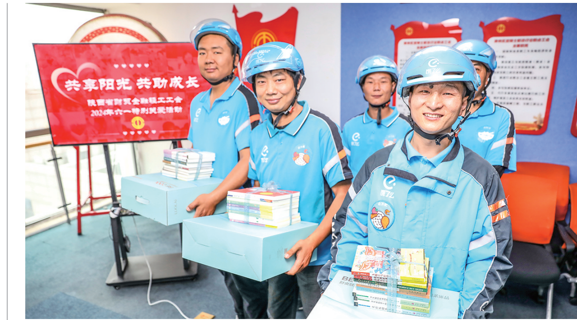
5月29日,省财贸金融轻工工会开展“共享阳光 共助成长”六一特别关爱活动。

当日,该工会走进西安市碑林区蓝骑士配送行业联合会、陕西祥云物流有限公司,通过座谈交流了解工会工作及外卖骑手、货车司机基本情况,开展建会入会、权益维护调研等工作,并发放书籍及慰问品。