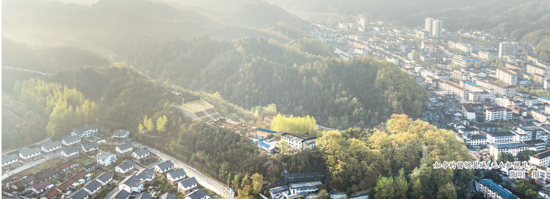
如今的留坝县城(无人机拍摄)