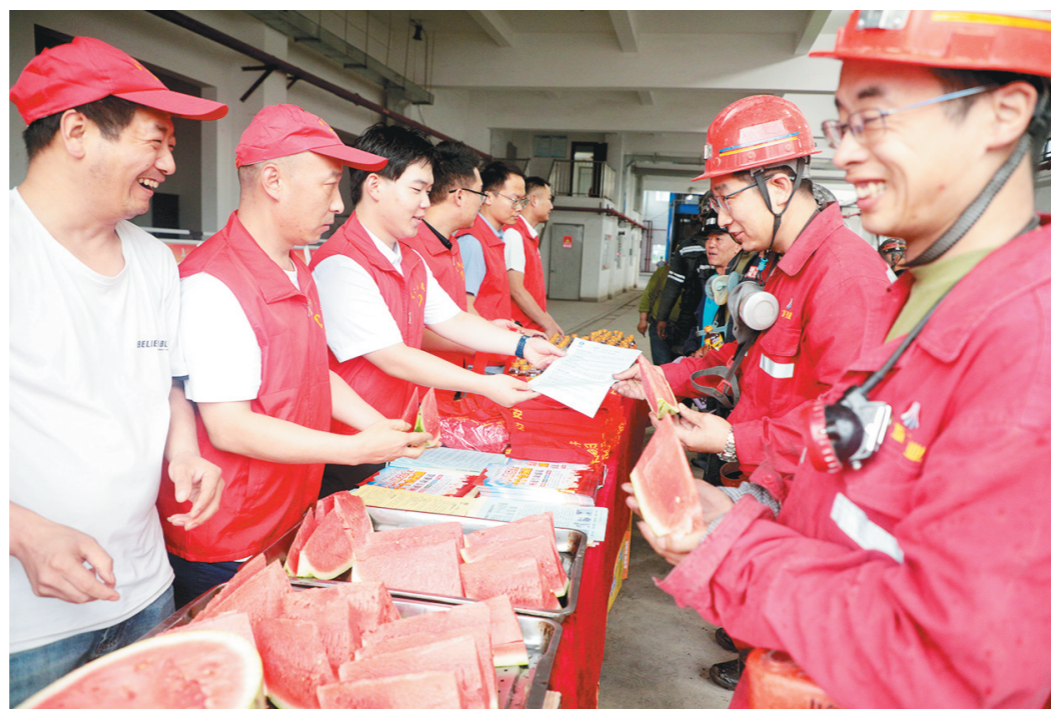
6月16日,陕煤集团韩城矿业王峰煤矿工会开展“致敬劳动者 夏日送清凉”活动。志愿者们为职工送上西瓜、白糖、绿豆以及寓意平安的红腰带,嘱咐职工一定要遵章守纪,按章操作。