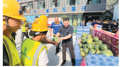
近日,中铁七局三公司工作人员到重黔铁路项目一线慰问职工,为大家送去防暑降温品。