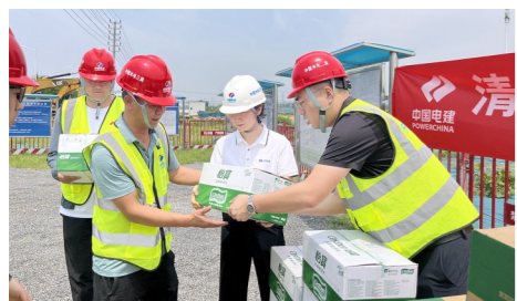
6月18日,水电三局华中公司工会到登封项目和七里河项目开展“清凉送一线,安康伴我行”慰问活动。