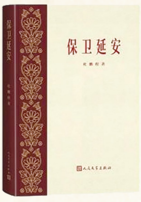
2023年人民文学出版社复刻版书影。