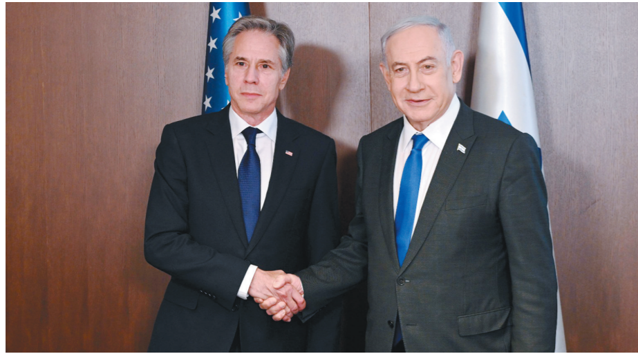
5月1日,在耶路撒冷,以色列总理内塔尼亚胡(右)会见到访的美国国务卿布林肯(左)。

只有结过婚,才能谈离婚。沙特与美国没有领过结婚证,79年来一直只是“事实婚姻”。不论是石油换安全,还是石油美元,都没有正式的协