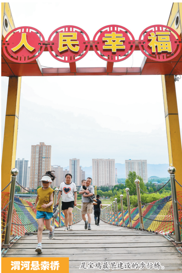
渭河悬索桥 是宝鸡最早建设的步行桥。