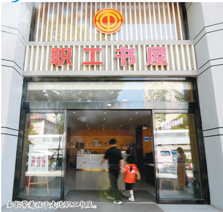
家长带着孩子走进职工书屋。

尽管在13个试点城市中,公积金制度已覆盖49.37万名灵活就业人员,但在这些城市庞大的灵活就业人员数量中,仍然占比较少。数据显示,我国灵活就业人员已达2亿人,如何让更多灵活就业人员看到参加公积金制度的好处并积极参与,这是试点城市要研究的问题,从而为其他城市积累宝贵经验。具体而言,试点城市既要互相学习也要勇于创新,而创新要围绕“活”做足文章,以求最大程度覆盖灵活就业者,除了在降低参与门槛、丰富缴存使用方式上灵活外,还要主动、善于倾听相关人群的意见。