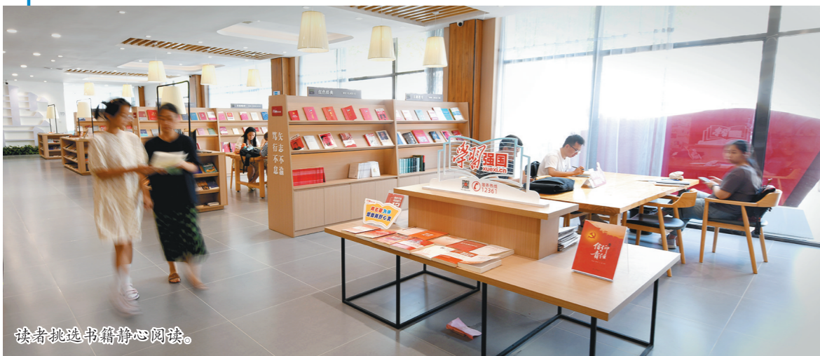
读者挑选书籍静心阅读。