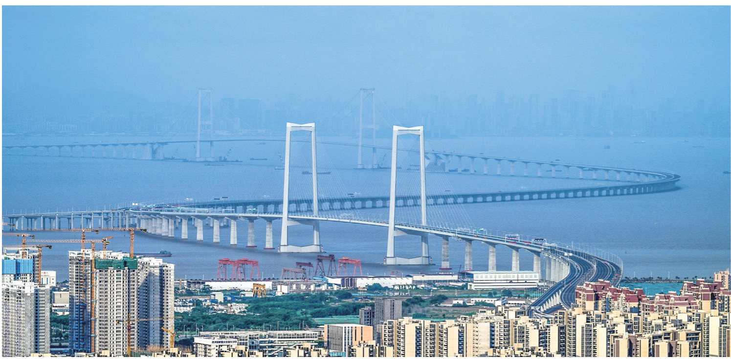
静待通车的深中通道(6月19日摄)。

深中通道是深圳至岑溪国家高速公路跨珠江口的关键控制性工程,路线全长约24公里。项目于2017年2月开工建设,历时7年建成开通,是全球首个集“桥、岛、隧、水下互通”为一体的跨海集群工程。项目通车后,深圳至中山的车程将从目前约2小时缩短至30分钟。