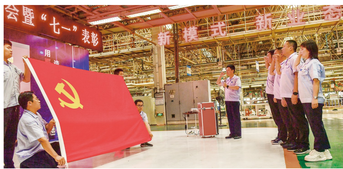
6月28日,陕汽控股汽车总装厂党委组织开展“七一”主题活动,新党员进行入党宣誓。