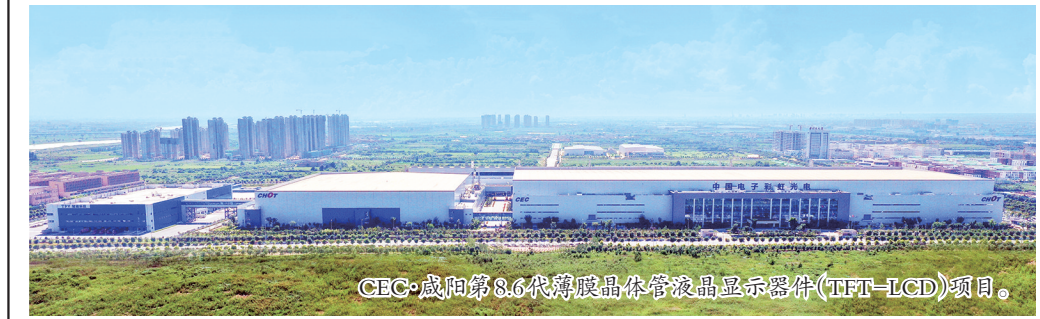
CEC·咸阳第8.6代薄膜晶体管液晶显示器件(TFT-LCD)项目。

可能造成的严重后果,负责人对照相关法规标准、管理制度和安全操作规程,讲解正确的操作方法,杜绝“三违”事故发生。此外,还开展铁屑入眼、火灾逃生、仪器砸伤、人员中暑等12场次实战演练,通过模拟突发事件,提升属地应急预案与现场的契合度,确保各岗位职工在出现紧急情况时能够冷静应对突发情况,提升救灾救助能力。