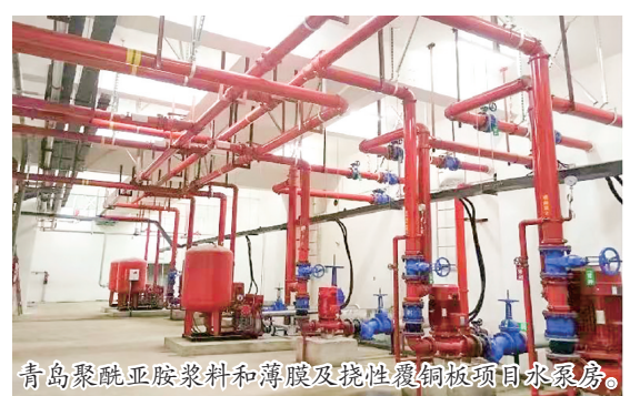
青岛聚酰亚胺浆料和薄膜及挠性覆铜板项目水泵房。