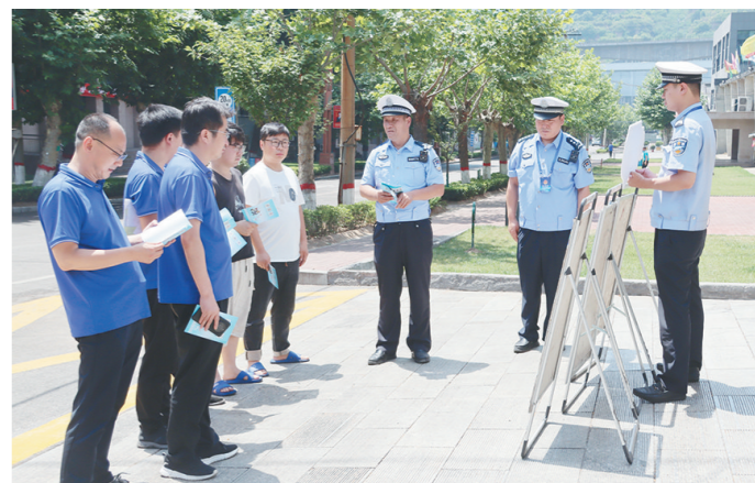
近日,韩城市交警大队桑树坪中队干警走进陕煤韩城矿业公司桑树坪矿区,开展面对面交通安全普法教育。