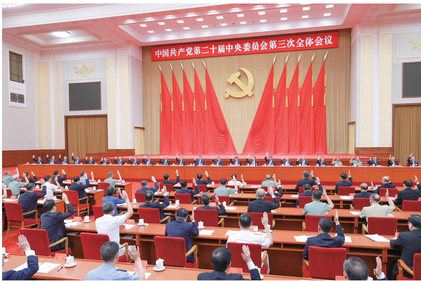
中国共产党第二十届中央委员会第三次全体会议,于2024年7月15日至18日在北京举行。中央政治局主持会议。