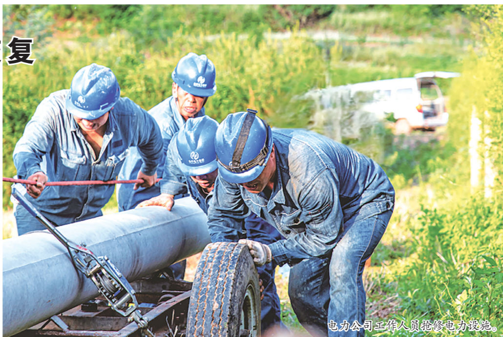
电力公司工作人员抢修电力设施。

在市区公园路积水路段,三名供电工人在淤泥中摸索线路,进行电路抢修。据国网宝鸡供电公司相关负责人介绍,电力部门针对暴雨损毁的电力设施第一时间赶赴现场勘查,制定抢修修复方案,实行24小时不间断抢修,针对部分小区用电难问题,他们提供照明灯具、发电机等应急装备200余台,保障群众用电。截至19日18时,除人员撤离的小区外,其余大部分小区用电恢复正常。此外,笔者从宝鸡市自来水公司了解到,目前全市用水基本正常。