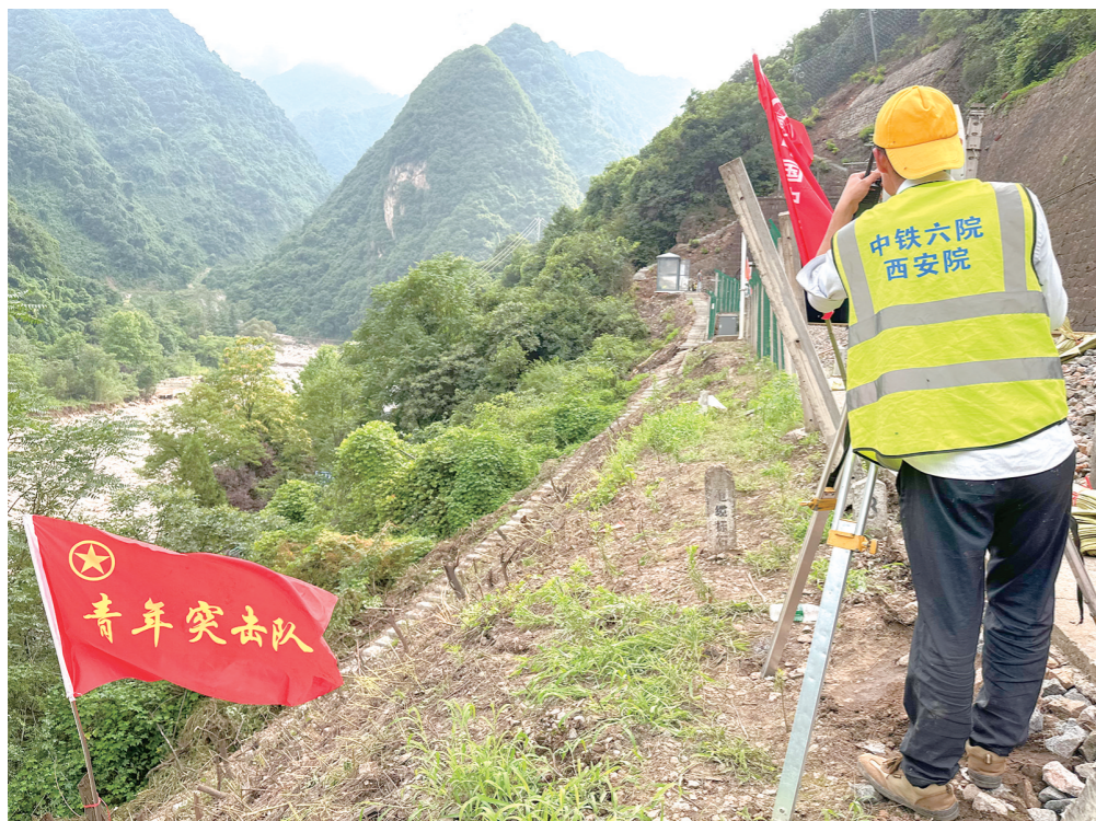
工作人员正在踏勘。

他们以高度的责任感和专业精神,全身心投入到抢险救灾这项急难险重的任务中,下一步还将继续坚守现场,为宝成线沿线尽快恢复安全畅通,确保铁路运输的安全与稳定,贡献西安院人的智慧和力量,诠释使命担当。(通讯员 宁豫)