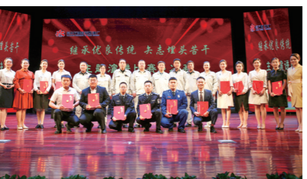
日前,延长石油延安炼油厂举办“继承优良传统 矢志埋头苦干”主题演讲比赛,来自各基层单位的12组优秀选手进入决赛角逐。图为获奖选手合影留念。