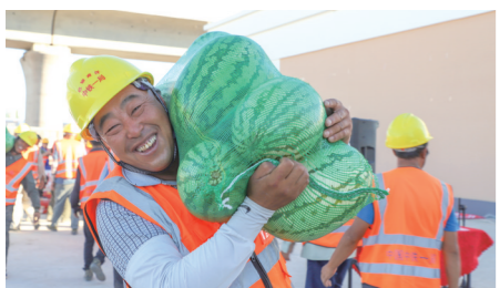
近日,中铁路运营(新运)公司在包铁铁路辅架工区举办“送清凉 送安全 送健康”慰问活动,为施工人员送去了肉、米、油、西瓜、饮料等慰问品。

务、推动科技创新、提升能力本领等方面的收获和体会,分享了从学生生涯转换到职场生涯的心路历程、经验心得,为新员工走上职业生涯、迈入工作岗位提供指导。随后,新员工逐一进行自我介绍,交流了入职以来的感受体会和未来的目标方向。