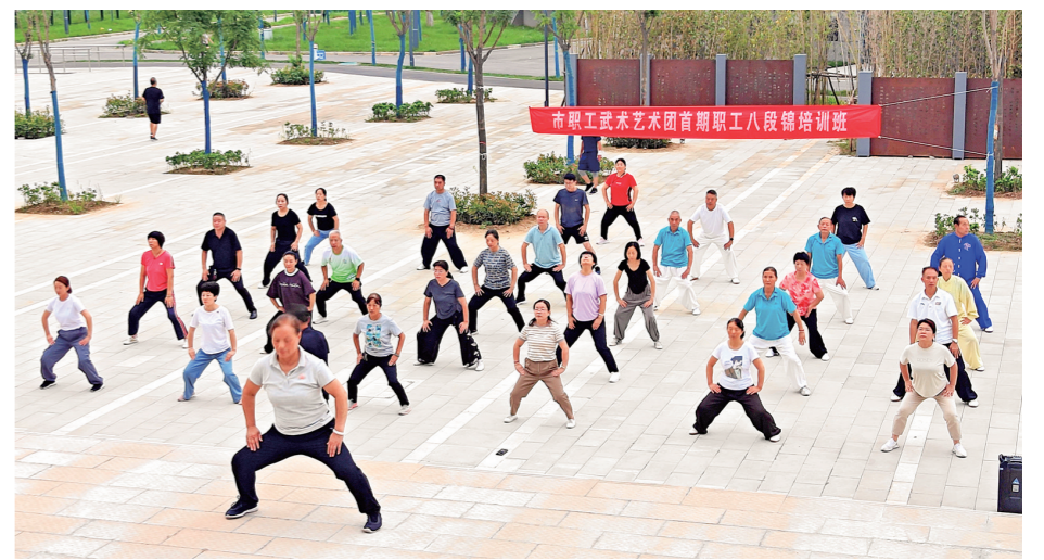
7月25日,由华阴市总工会指导、职工武术艺术团主办的首期职工八段锦培训班圆满结业。来自该市各行业的30余名职工和武术爱好者在专业

都仿佛在讲述着军人的英勇与担当。本场音乐会在形式和内容上进行了大胆创新,在军旅歌曲演唱的同时,穿插进行《我的祖国》《人民军队忠于党》《钢铁洪流进行曲》等管乐演奏,并邀请观众上台演唱。音乐会还设置了多个互动环节,采用线上线下相结合的方式,让更多观众参与演出,感受军民鱼水情的深厚情谊。