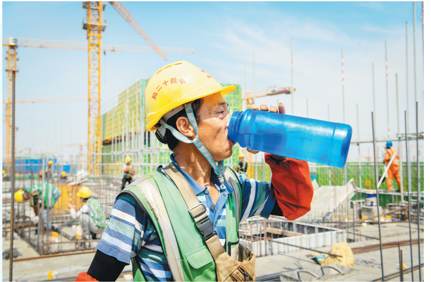
工人喝水解暑。