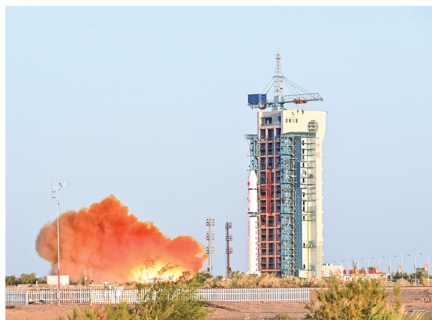
9月27日18时30分,我国在酒泉卫星发射中心采用长征二号丁运载火箭,成功发射首颗可重复使用返回式技术试验卫星——实践十九号卫星,卫星顺利进入预定轨道。

“总体看,规上工业企业利润延续增长态势,工业新动能支撑作用彰显,但同时也要看到,国内消费需求依然偏弱,外部环境复杂多变,工业企业效益恢复基础仍需继续巩固。”于卫宁说,下阶段,要坚决贯彻落实党的二十届三中全会决策部署,加快培育壮大新动能,积极扩大国内有效需求,进一步推动大规模设备更新和消费品以旧换新,不断夯实工业企业效益恢复基础。