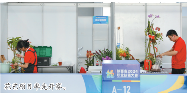
花艺项目率先开赛。

龄27岁。其中,30岁以下252人,占比62.4%;男选手302人,占比74.8%;以职工身份参赛的198人,占比49%。根据竞赛规则,大赛设个人奖、团体奖和组织奖。对以职工身份参赛的优胜选手,将按照有关规定晋升职业技能等级,并对获得单人赛项前5名、双人赛项前3名的选手,经核准授予“陕西省技术能手”称号。对以学生身份参赛的优胜选手,则按照有关规定晋升职业技能等级。