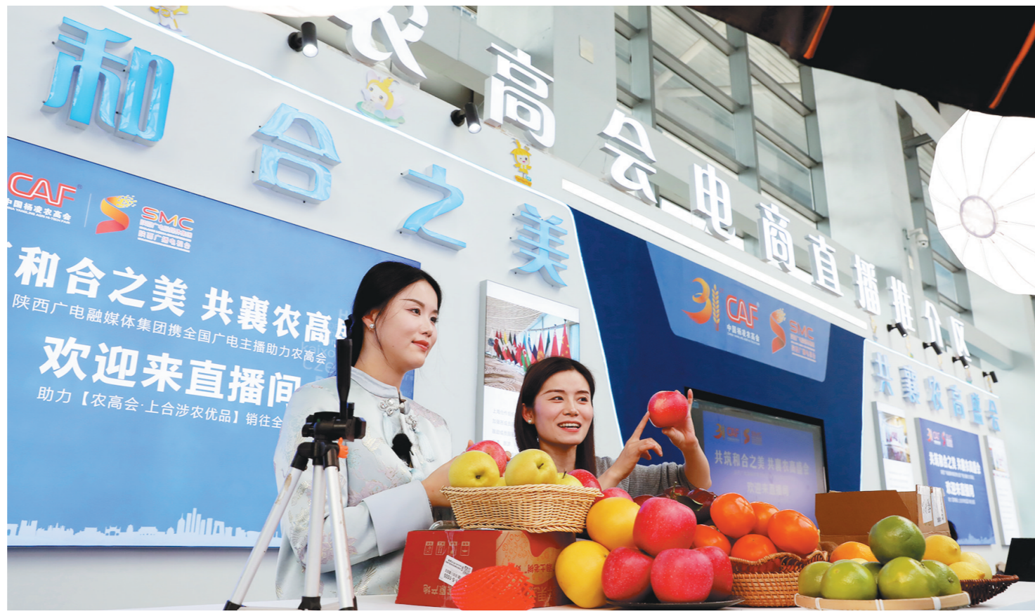
10月26日，两名主播在农高会现场为观众介绍水果。 第三十一届农高会期间，云上农高会通过“会展+电商”融合新模式，将展团、企业经选的优质产品同步推介至自