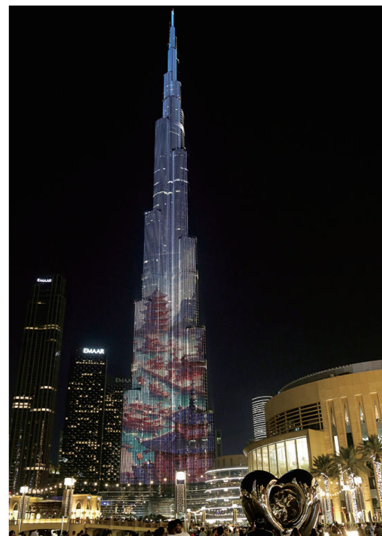
11月1日,阿联酋迪拜哈利法塔上演灯光秀,以“友谊四十载 未来更可期”为主题,展示中国与阿联酋共建40年来在科技、航天、文化、旅游等领域的友好合作。

以军当天发布的一段视频显示,导弹击中了一辆行驶中的车辆,卡萨卜和他的一名助手被炸死。哈马斯方面证实两人已死亡。