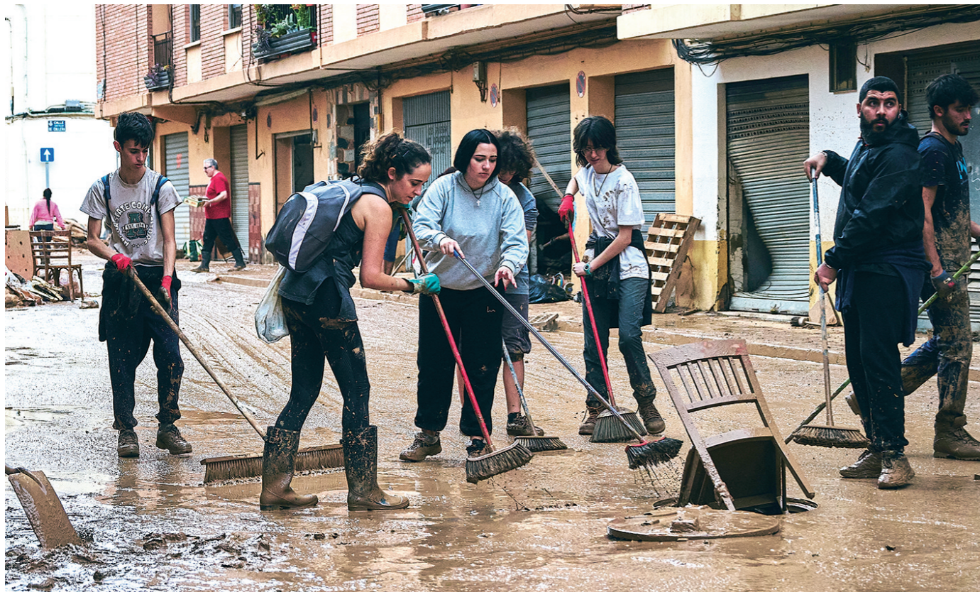
11月1日,在西班牙巴伦西亚省,人们在街道上进行清理工作。西班牙东南部从10月29日开始的强降雨引发严重洪灾。至11