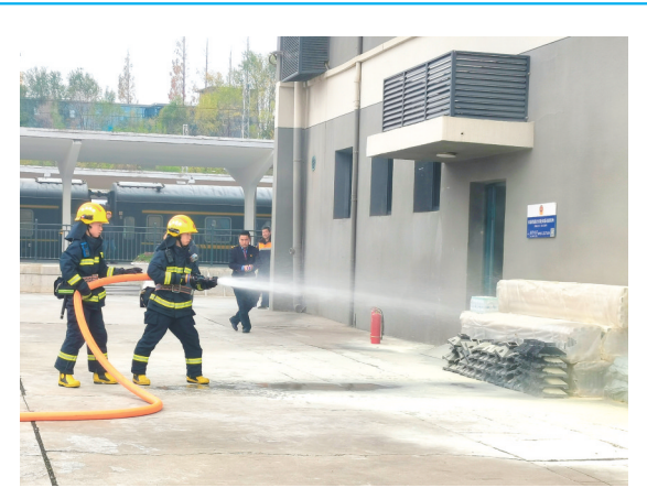
11月26日，安康火车站等单位开展应急演练，进一步提升路、地联防联控应急处突处置能力。

该公司成立了20个冬季安全用电宣传小分队，结合“大走访”活动加大对用户安全用电、节约